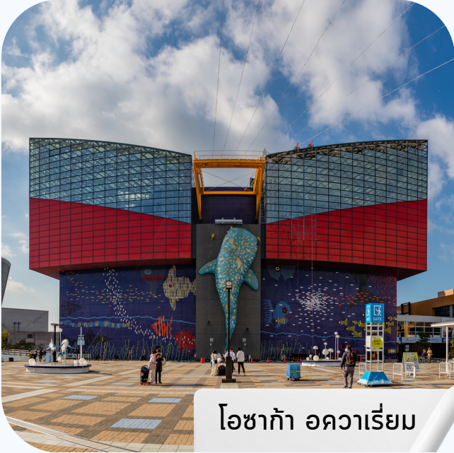
โอซาก้า อควาเรียม