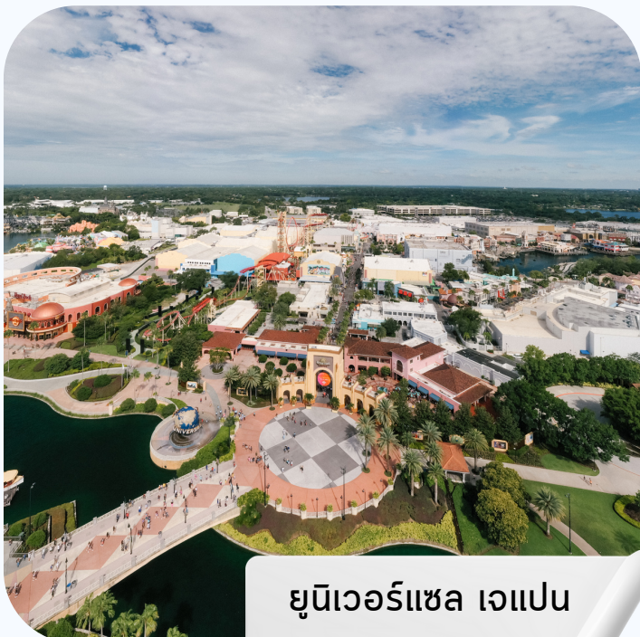
ยูนิเวอร์แซล แจแปน