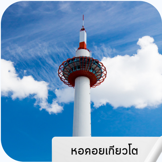
หอคอยเกียวโต