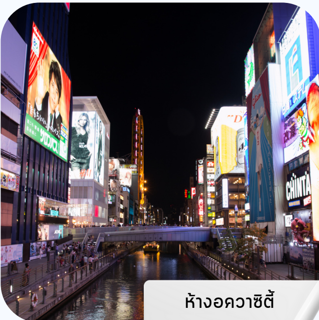
ห้างอควาซิตี