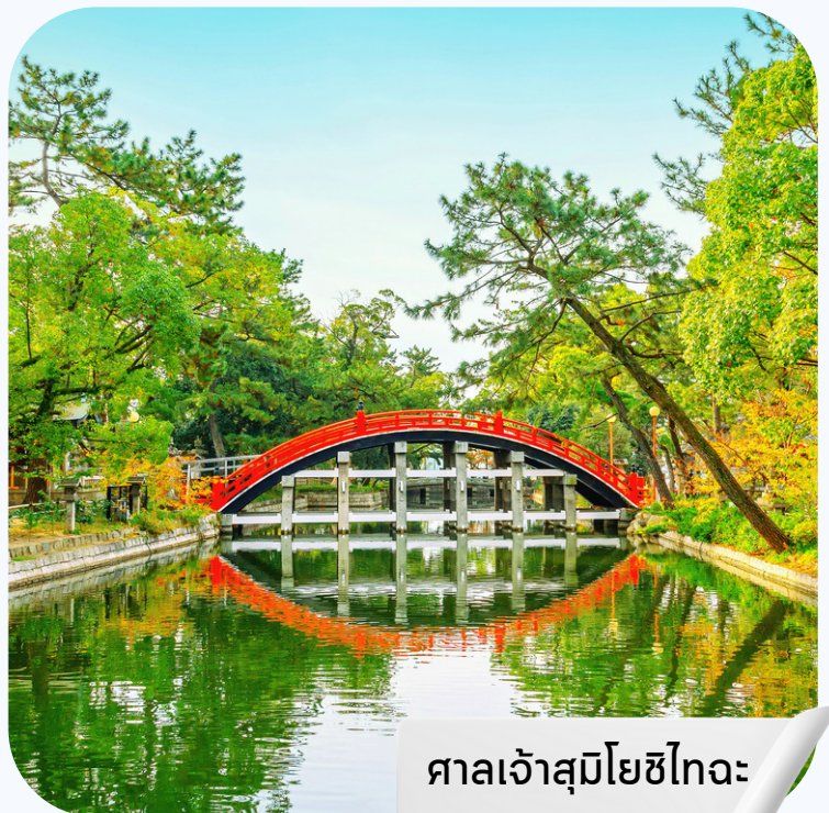
ศาลเจ้าสุมิโยชิไทอะ