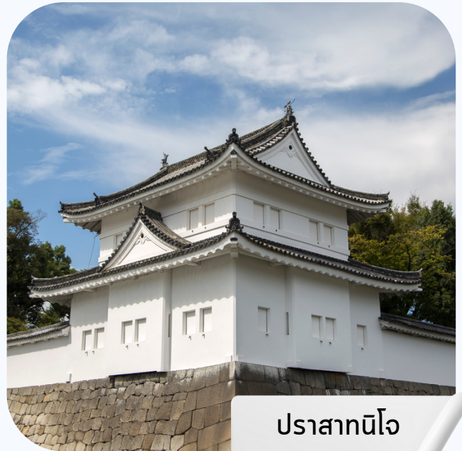
ปราสาทนินโจ