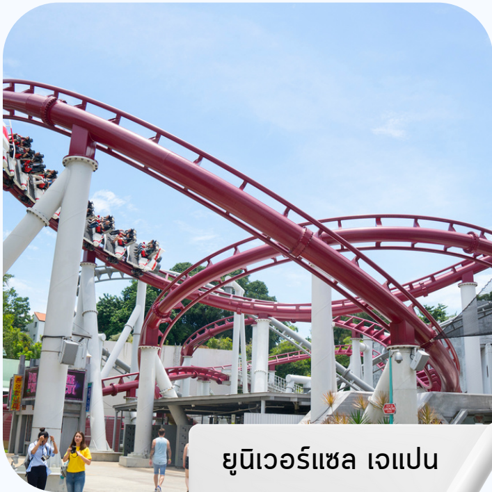
ยูนิเวอร์แซล แจแปน