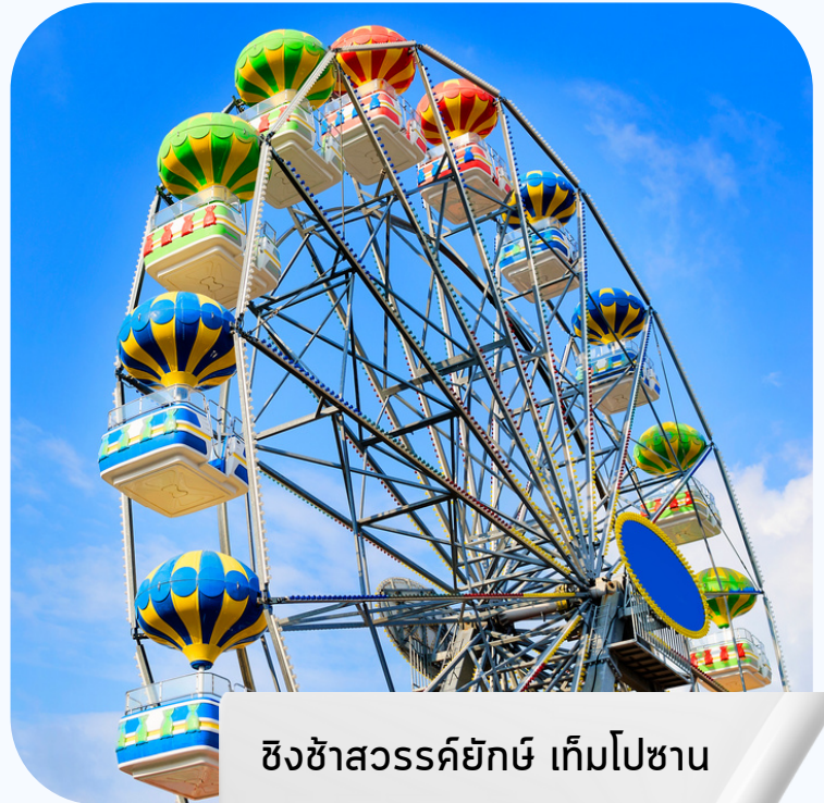
ชิงช้าสวรรค์ยักษ์ เต็มไปซาน