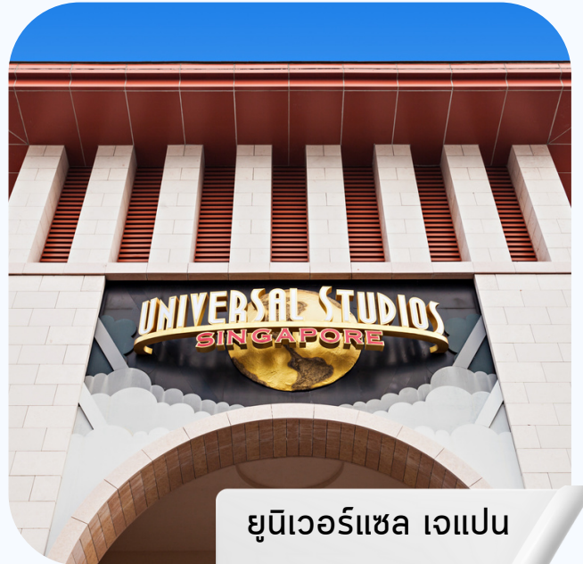
ยูนิเวอร์แซล แจแปน