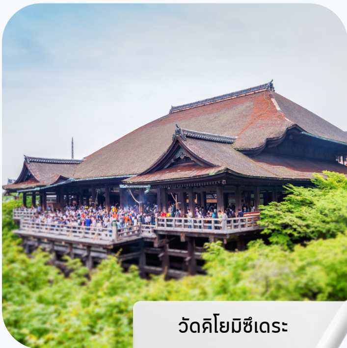
วัดคิโยมิซึเดระ