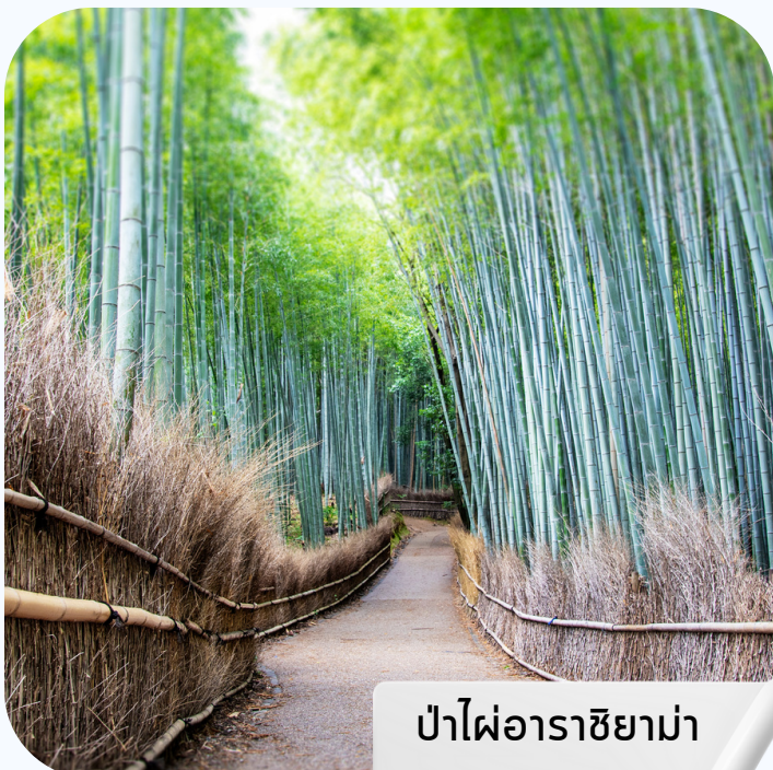
ป่าไผ่อาราชิยาม่า