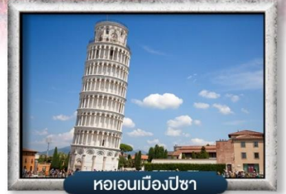
หออนเมืองปิซา

พิเศษ! สปาเกตตี้เส้นหมึกดำ, พิซซ่าสไตล์อิตาลีแสนแท้