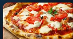
พิซซ่าสไตล์อิตาลีแสนแท้