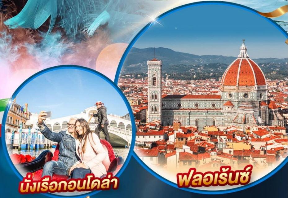
นั่งเรือกอนโดลา

รวมทุกอย่าง!! ไม่ต้องจ่ายหน้างาน วีซ่า ก็ปห้องถิ่น ตัวประกันโรงแรม หัวหน้าทัวร์