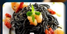
สปาเกตตีเส้นหมึกดำ