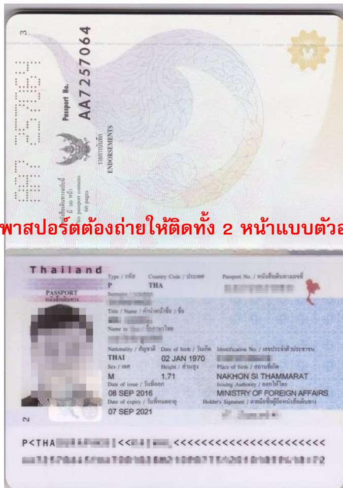
พาสปอร์ตต้องถ่ายให้ติดทั้ง 2 หน้าแบบตัวอย่าง