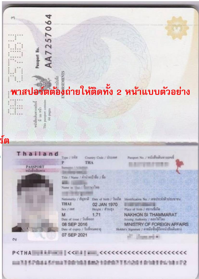
Paper Photo for Visa Application Form