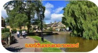
เบอร์ตันออนเดอวอเตอร์