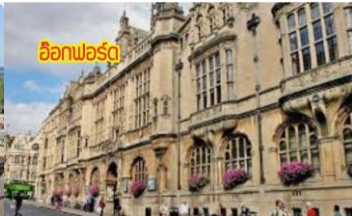
อ็อกซ์ฟอร์ด