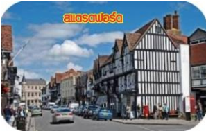
สเตรตฟอร์ด

นำท่าน ชมบ้านเกิดของกวีเอกเชคสเปียร์ (ไม่รวมค่าเข้าชมถ้ามี) ซึ่งเป็นที่รวบรวมชีวประวัติ และผลงานทั้งหมดของเชคสเปียร์ และตัวบ้านยังคงเอกลักษณ์ของรูปแบบเฉพาะของเมืองสเตรตฟอร์ดภายในเมืองอบอวลไปด้วยบรรยากาศแห่งละคร และวรรณกรรมที่ควรค่าแก่การมาเยี่ยมชมยิ่งนัก