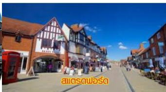
สเตรตฟอร์ด