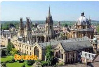
อ็อกซ์ฟอร์ด

จากนั้นนำท่านเดินทางสู่ เมืองอ็อกซ์ฟอร์ด (OXFORD) เมืองแห่งมหาวิทยาลัย .... ถ่ายรูปกับตัวอาคารของ ไคร์ซเซิร์ทคอลเลจ