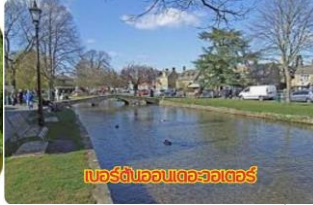
เบอร์ตันออนเดอวอเตอร์

นำท่าน ชมบ้านเกิดของกวีเอกเชคสเปียร์ (ไม่รวมค่าเข้าชมถ้ามี) ซึ่งเป็นที่รวบรวมชีวประวัติ และผลงานทั้งหมดของเชคสเปียร์ และตัวบ้านยังคงเอกลักษณ์ของรูปแบบเฉพาะของเมืองสเตรตฟอร์ดภายในเมืองอบอวลไปด้วยบรรยากาศแห่งละคร และวรรณกรรมที่ควรค่าแก่การมาเยี่ยมชมยิ่งนัก