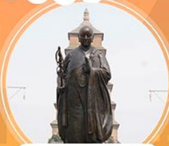
วัดพระกั๋งซันจ้ง

ไต้หวัน ไทจง หนานโกว ไทเป เหง่หลิว ล่องเรือทะเลสาบสุริยันจันทรา แลนด์มาร์คดีทิกไทเป 101 หมู่บ้านสายรุ้ง วัดพระกั๋งซันจ้ง วัดเหวินหวู่ อนุสรณ์สถานเจียงไคเชก พัก : ไทเป 2 คืน ไทจง 1 คืน มีน้ำดื่มบริการบนรถบัสส่วนตัว 1 ขวด