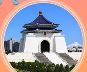
อนุสรณ์สถานเจียงไคเชก

ตลาดฟ่งเจีย ตลาดซีเหมินติง และตลาดช้อหลิน