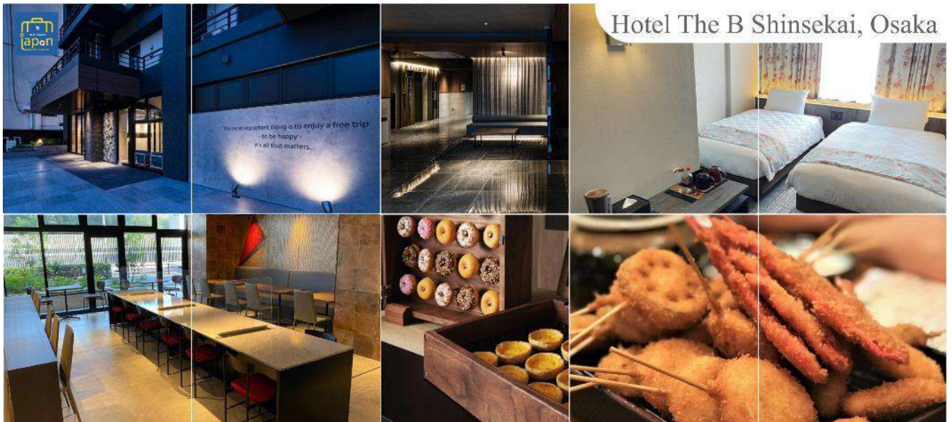
Hotel The B Shinsekai, Osaka

พักที่ HOTEL THE B SHINSEKAI, OSAKA หรือเทียบเท่าระดับเดียวกัน