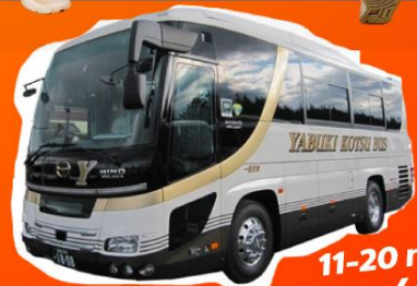
11-20 คน 28,000 THB / DAY