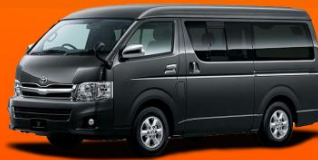
6-10 คน 25,000 THB / DAY