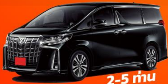
2-5 คน 18,000 THB / DAY