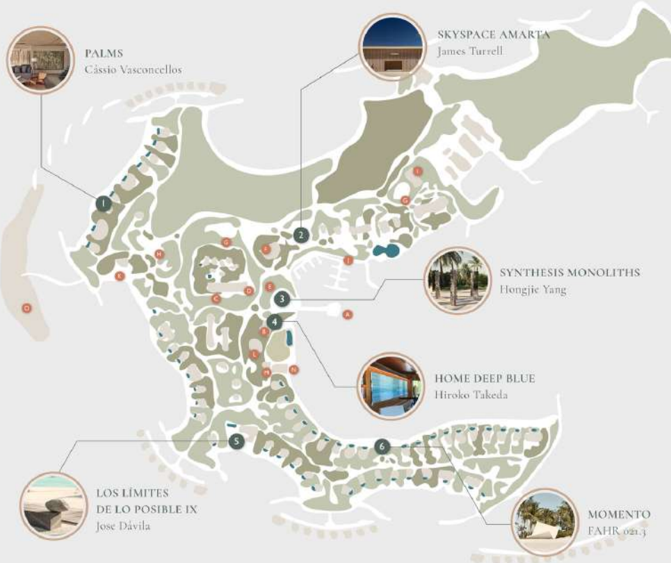
Images Skyspace Amarta by James Turrell, courtesy of Fernando Guerra, Home Deep Blue by Hiroko Takeda, courtesy of The Artling. All other images, courtesy of Patina Maldives & Georg Kocher.

Patina Maldives, Fari Islands Resorts is where art, nature, space and community harmoniously coexist and interact to create fruitful and long-lasting relationships. Visitors are welcome to explore the resort's art collection as they make space for a new-found spirit of wonder, reflection and interaction in their own lives.