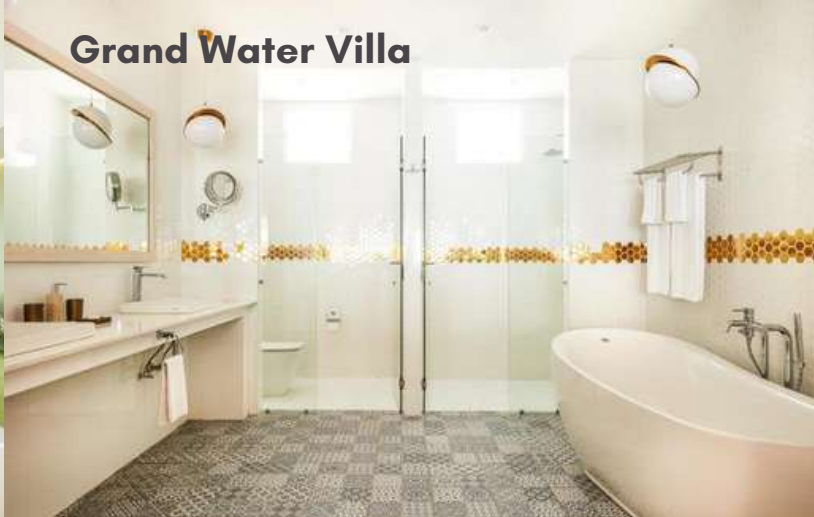
Grand Water Villa