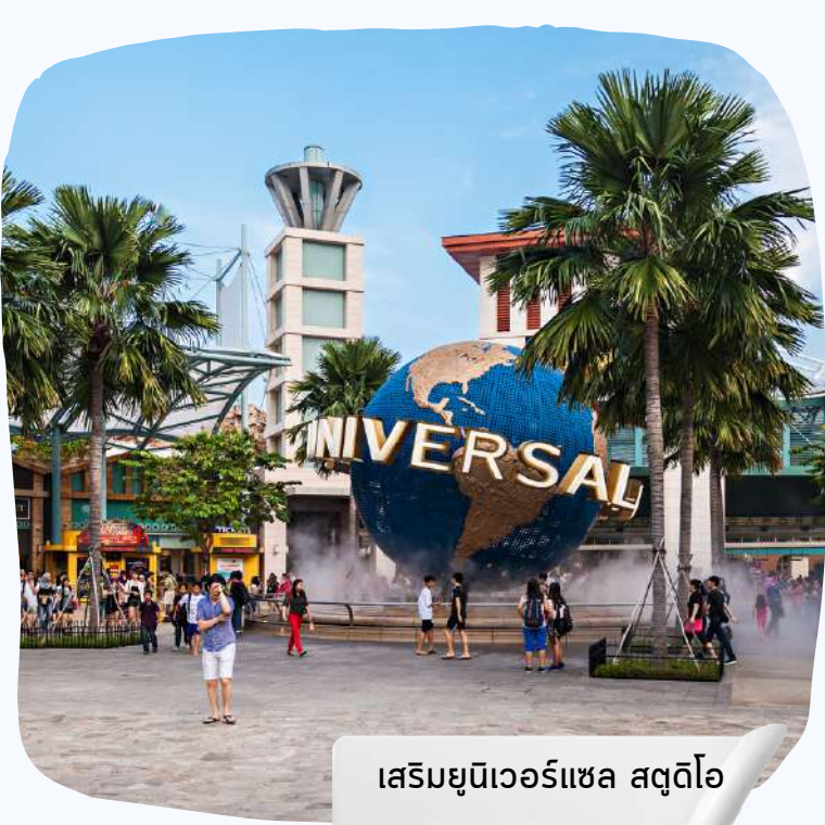
เสริมยูนิเวอร์แซล สตูดิโอ