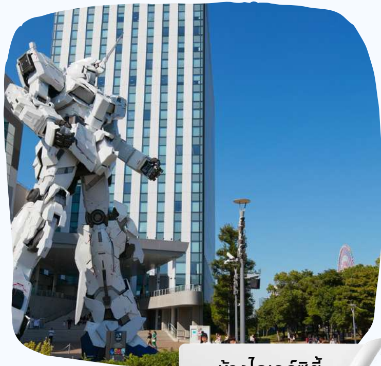
ห้างไดเวอร์ซิตี