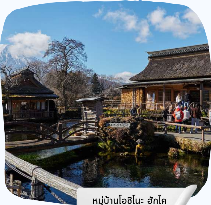
หมู่บ้านโอชิโนะ ฮักไก