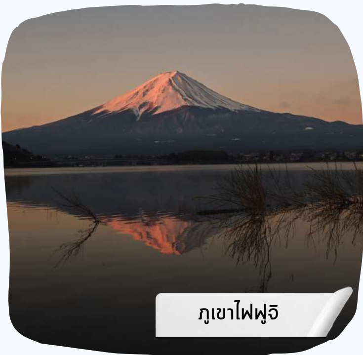
ภูเขาไฟฟูจิ