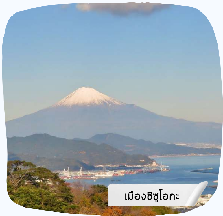
เมืองชิซูโอกะ