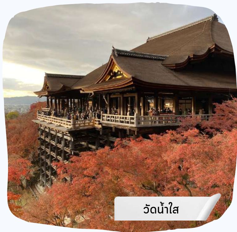
วัดน้ำใส