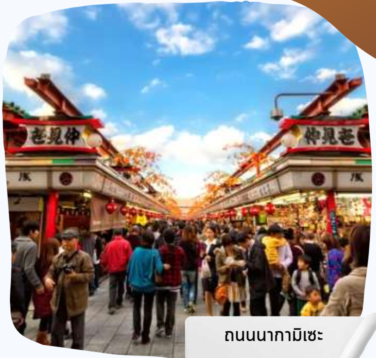
ถนนกามิเซะ