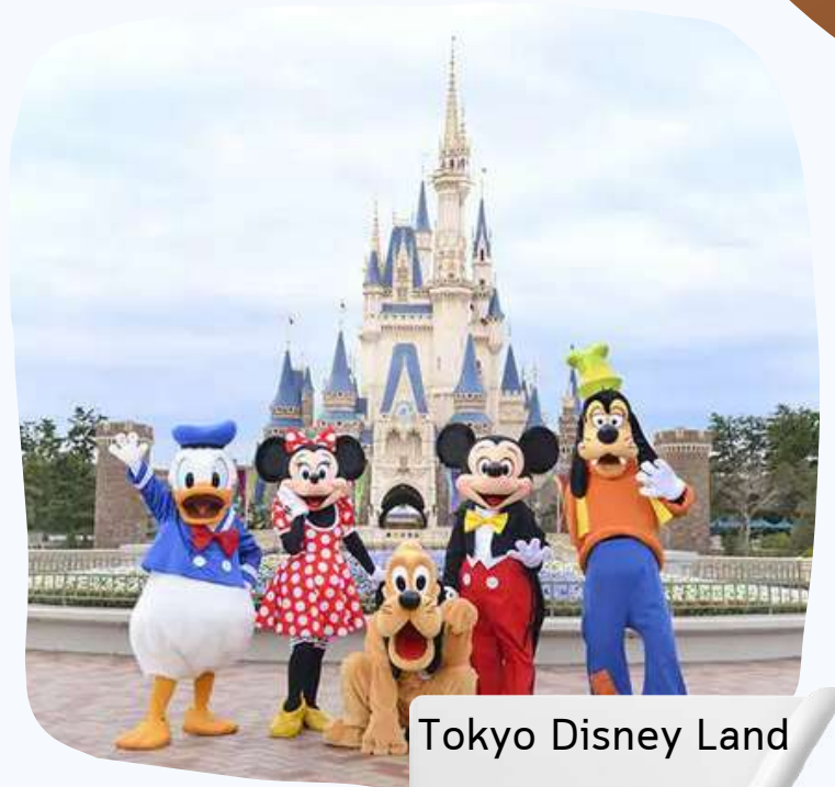
Tokyo Disney Land