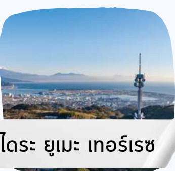
นิฮงโดระ ยูเมะ เทอร์เรซ