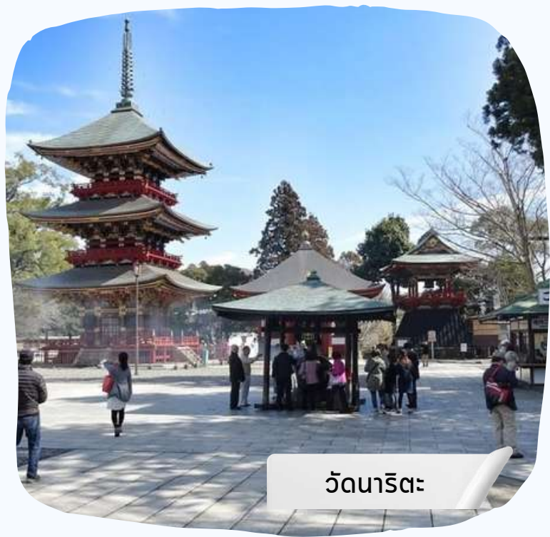
วัดนาริตะ