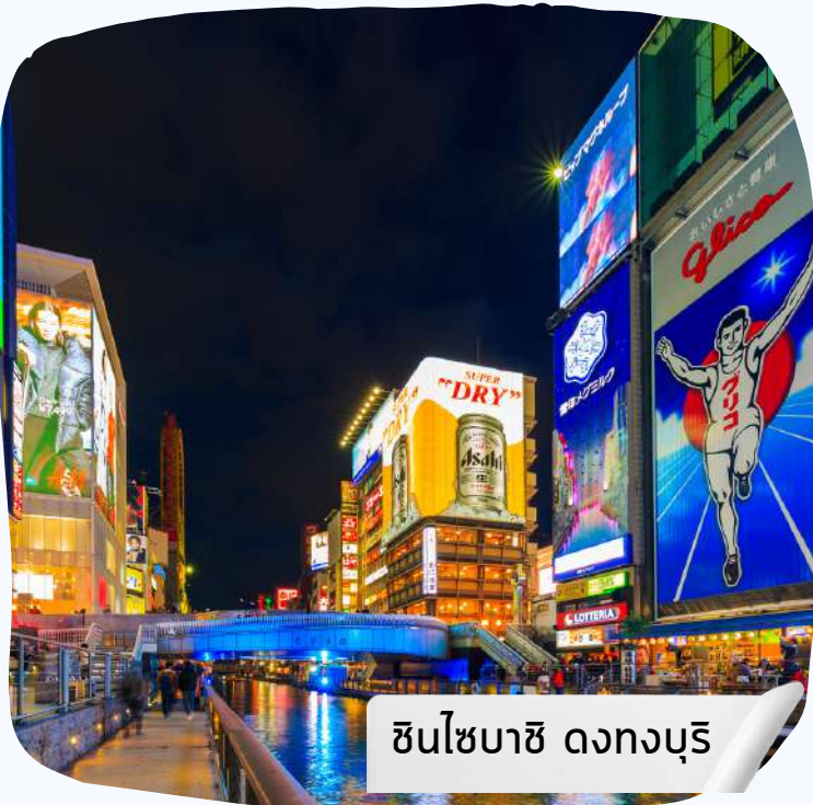
ชินไซบาชิ ดงทงบุรี