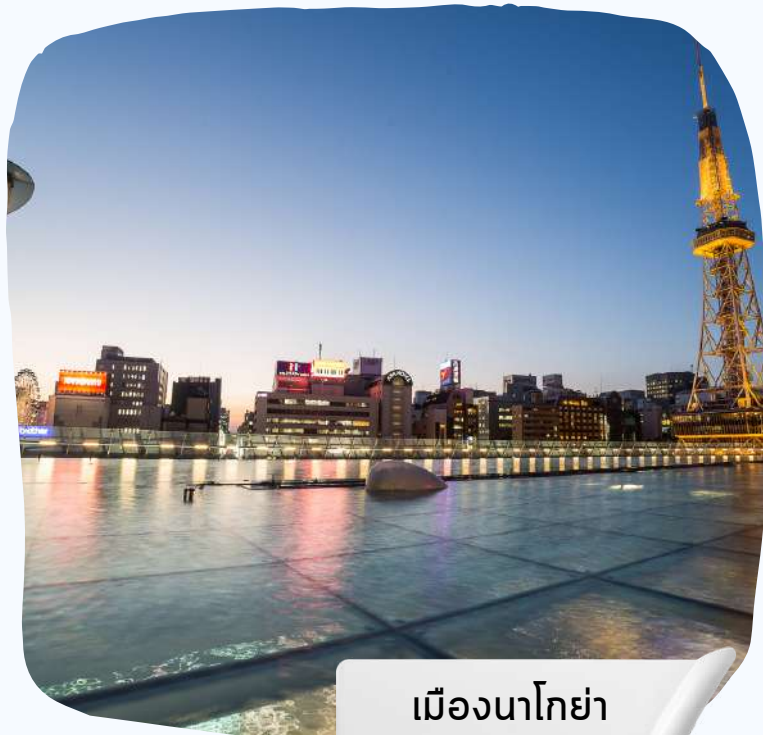
เมืองนาโกย่า