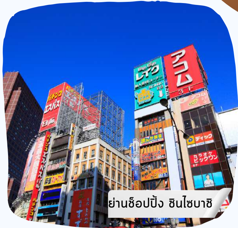
ย่านช้อปปิ้ง ชินไซบาชิ