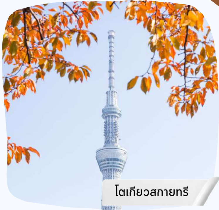
โตเกียวสกายทรี