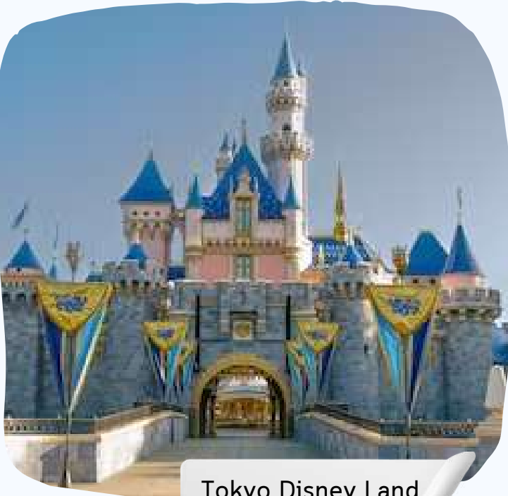
Tokyo Disney Land