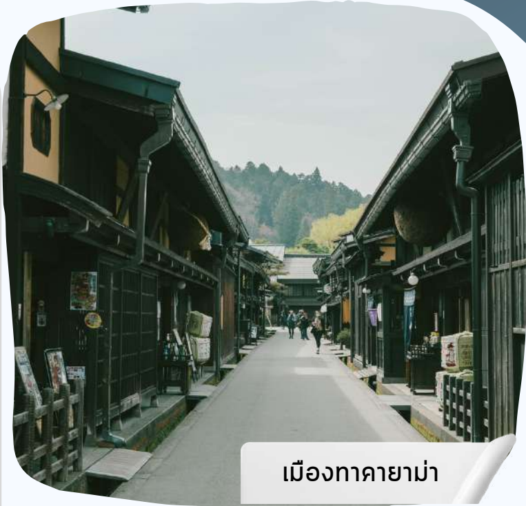
เมืองทาคายาม่า