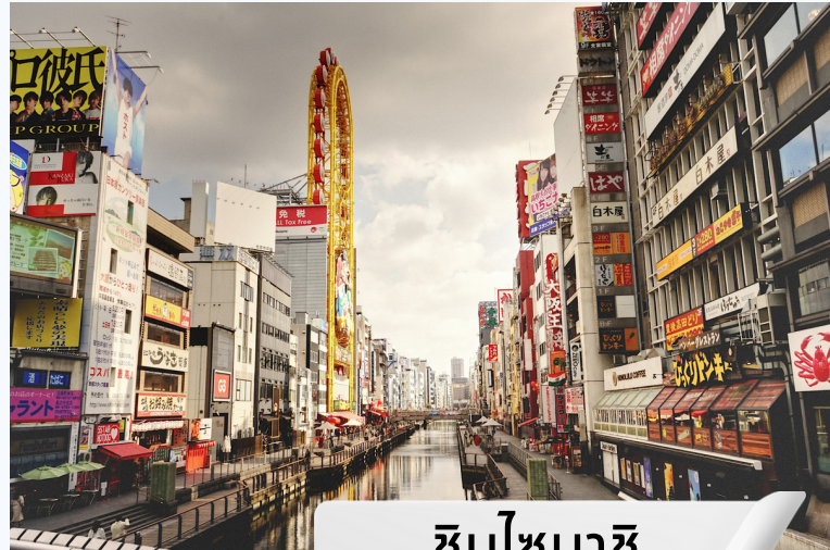
ชินไซบาชิ