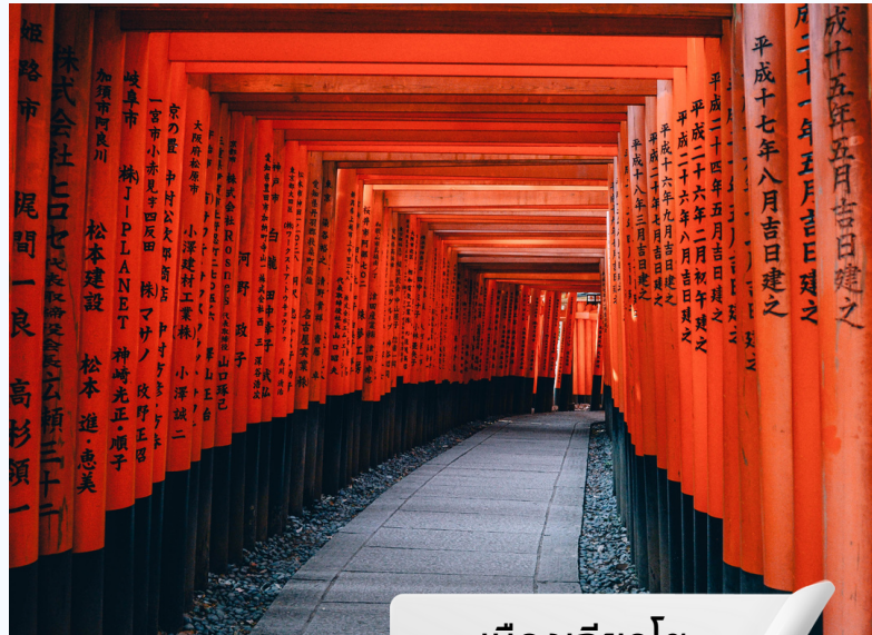
เมืองเกียวโต