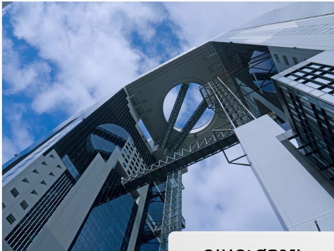
อุเมดะสกาย