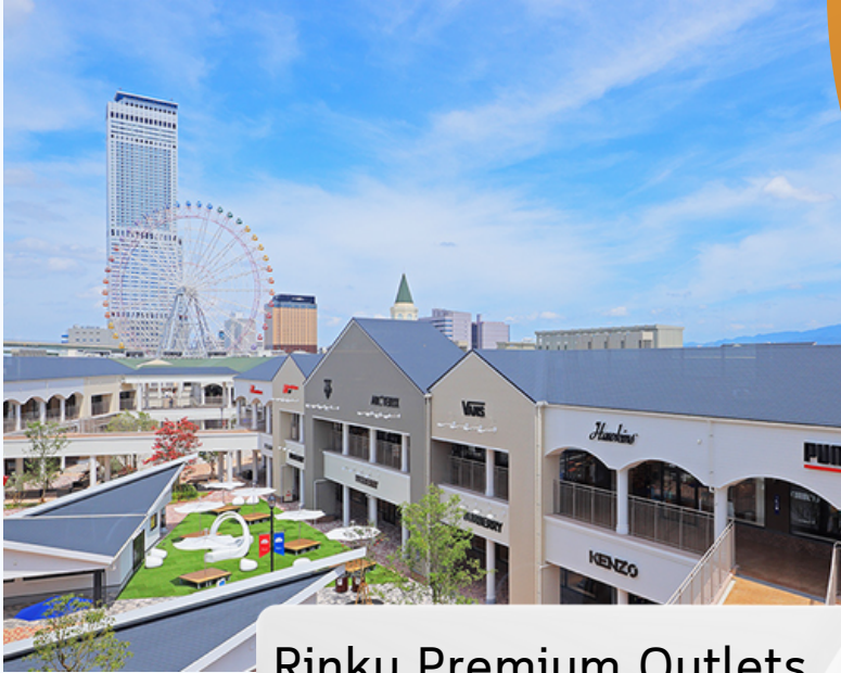
Rinku Premium Outlets