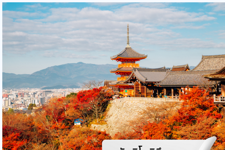
วัดคิโยมิซึเดระ