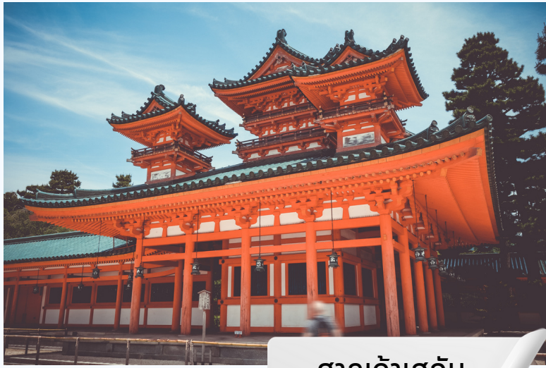
ศาลเจ้าเฮอัน