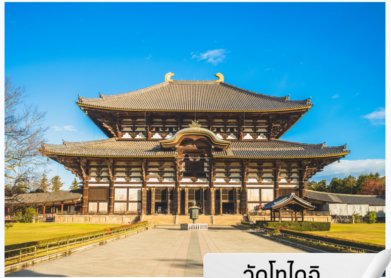
วัดโทไดจิ