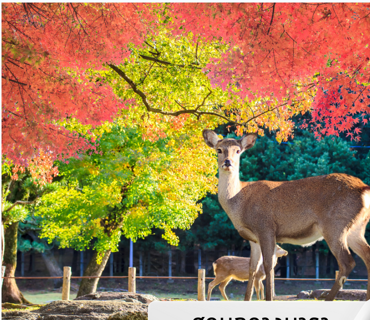
สวนกวางนารา