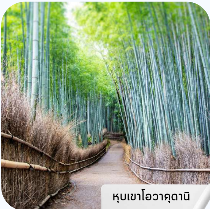
หุบเขาโอวาคุดานิ