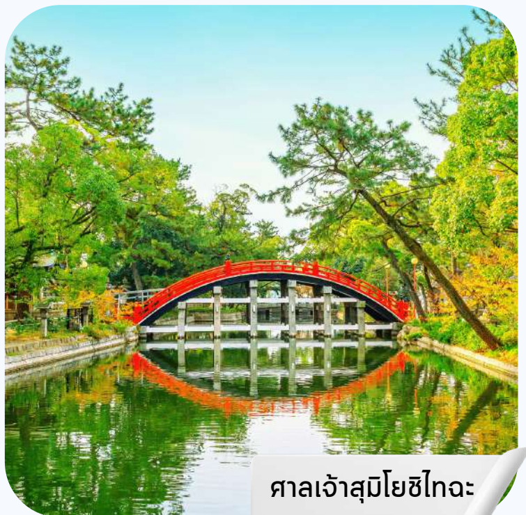
ศาลเจ้าสุมิโยชิไทอะ