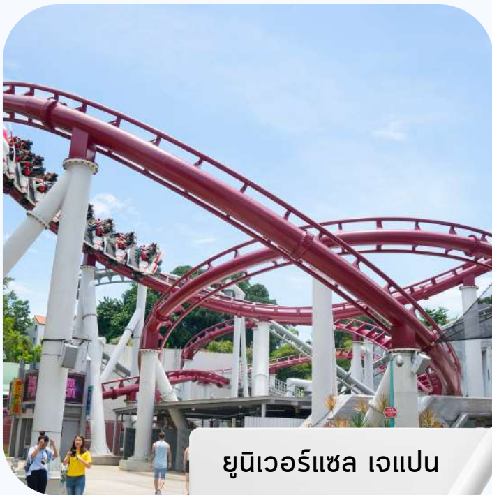
ยูนิเวอร์แซล แจแปน