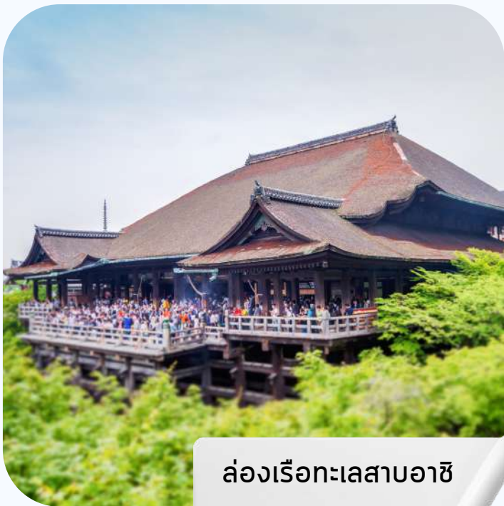
ล่องเรือทะเลสาบอาชิ