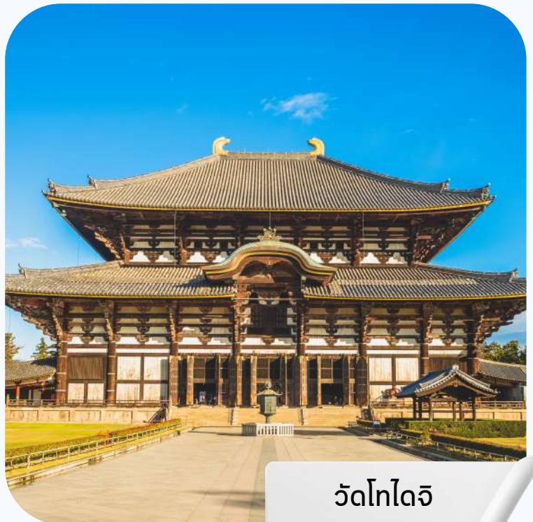
วัดโทไดจิ