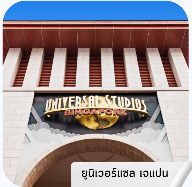
ยูนิเวอร์แซล แจแปน