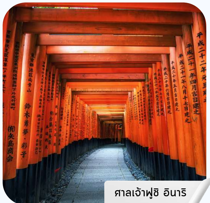
ศาลเจ้าฟูชิ อินาริ