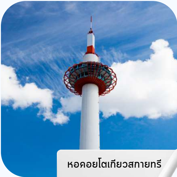
หอคอยโตเกียวสกายทรี