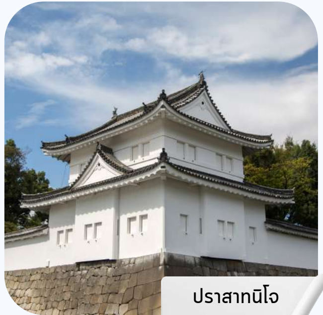
ปราสาทนินโจ