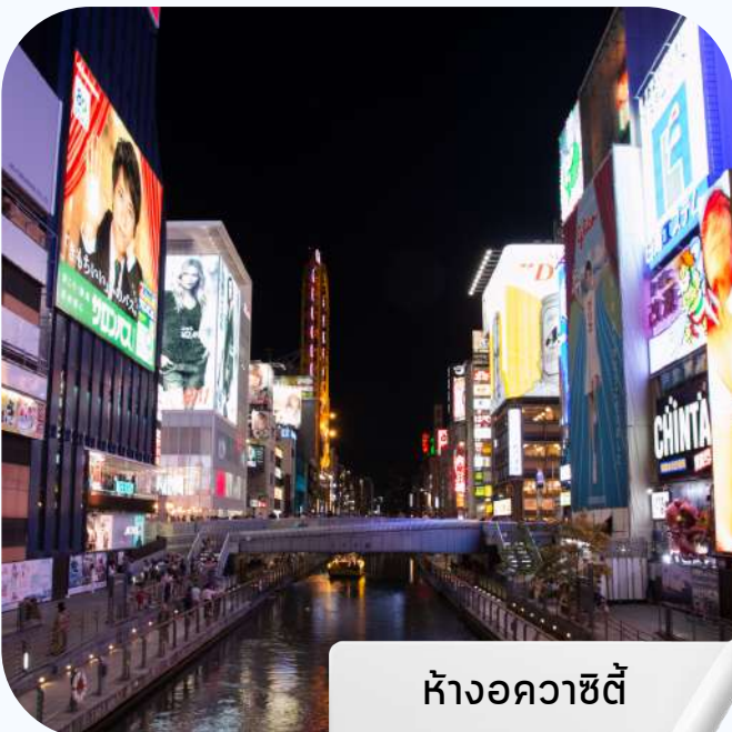
ห้างอควาซิตี