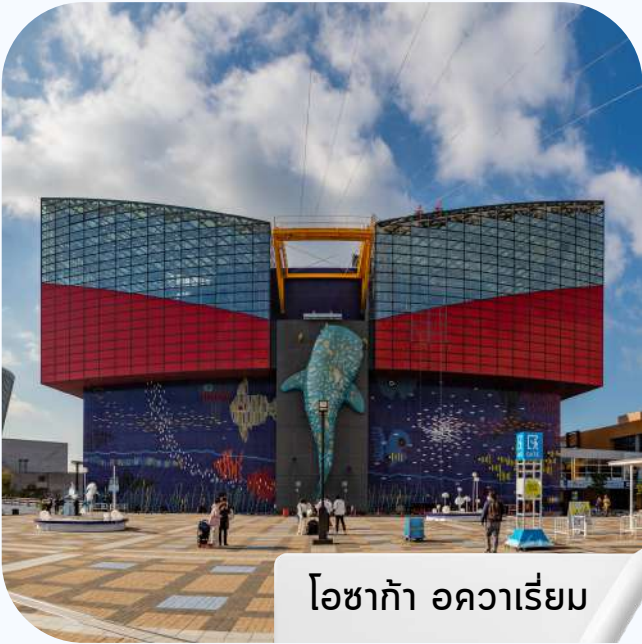
โอซาก้า อควาเรียม