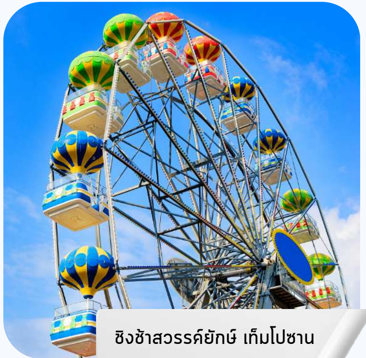
ซิงช้าสวรรค์ยักษ์ เต็มไปซาน