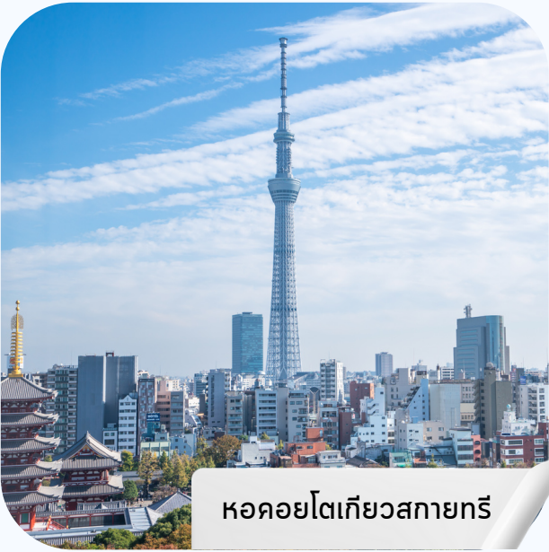
หอคอยโตเกียวสกายทรี