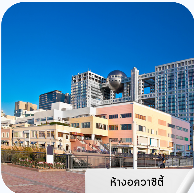
ห้างอควาซิตี