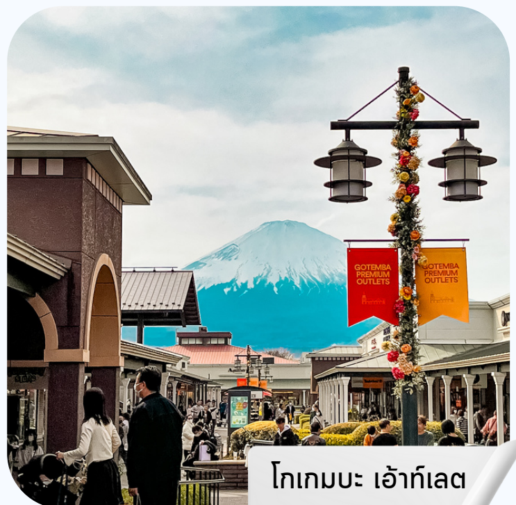
โทเกมบะ เอ้าท์เลต