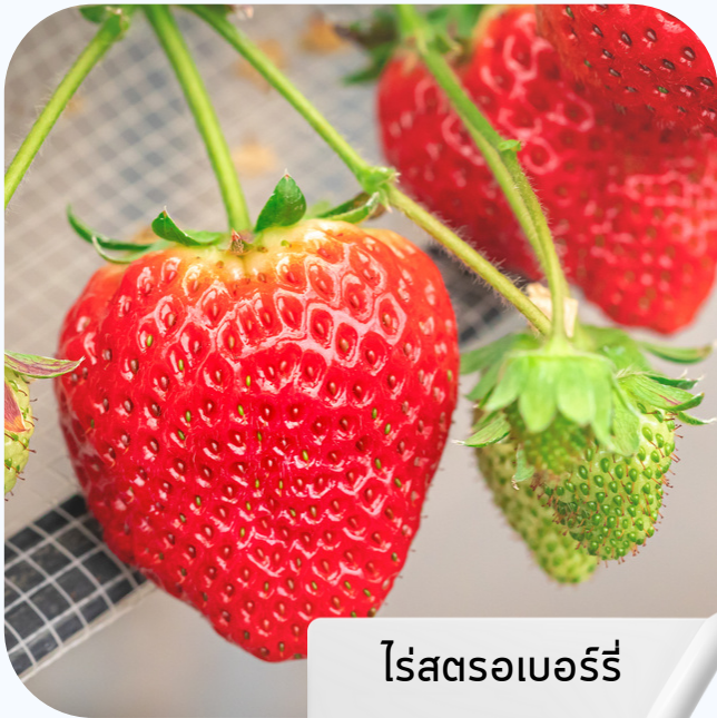
ไร่สตรอเบอร์รี่