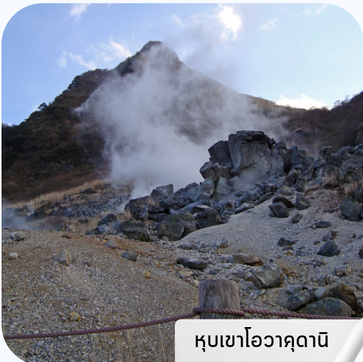
หุบเขาโอวาคุดานิ