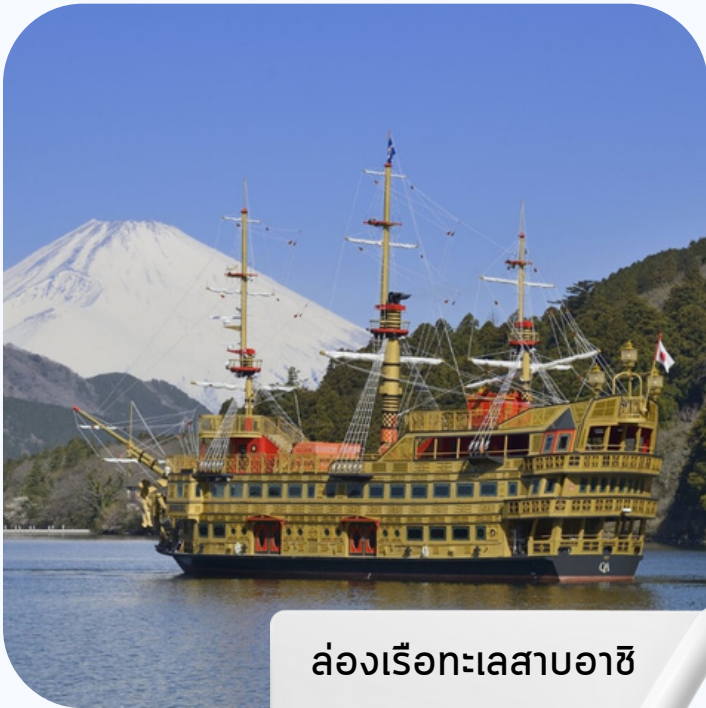
ล่องเรือทะเลสาบอาชิ