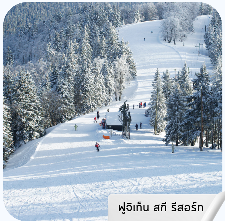
ฟุจิเท็น สกี รีสอร์ท