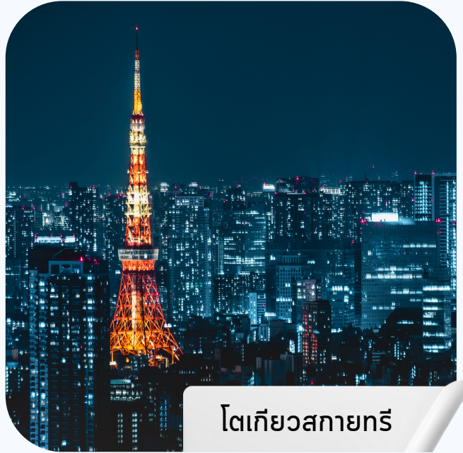
โตเกียวสกายทรี