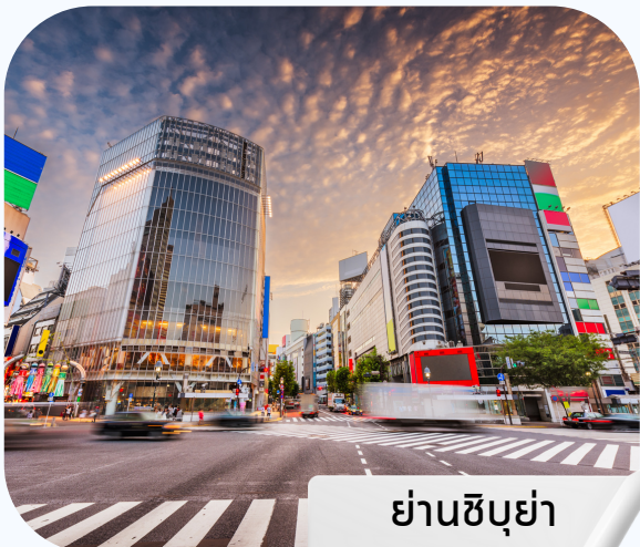
ย่านชิบูย่า