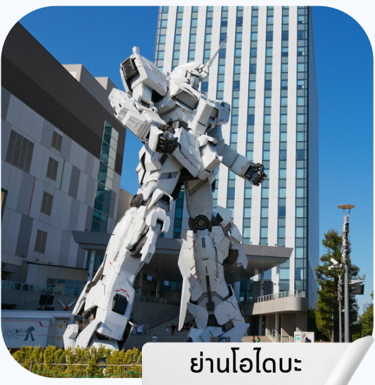
ย่านโอไดบะ