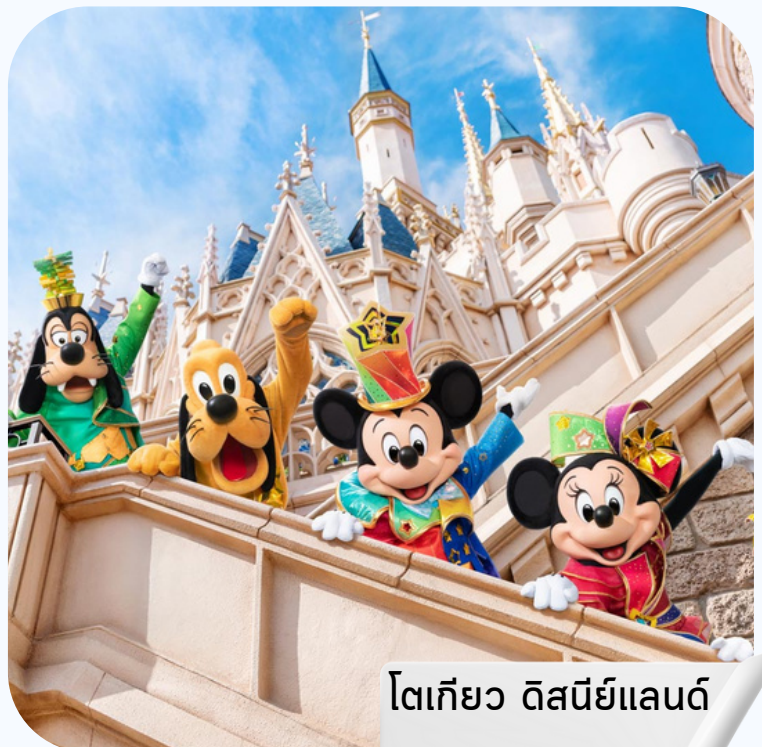
โตเกียว ดิสนีย์แลนด์