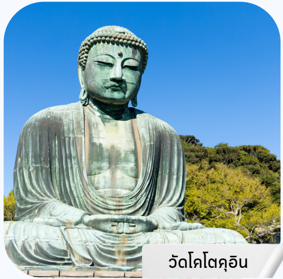
วัดโคโตคุอิน