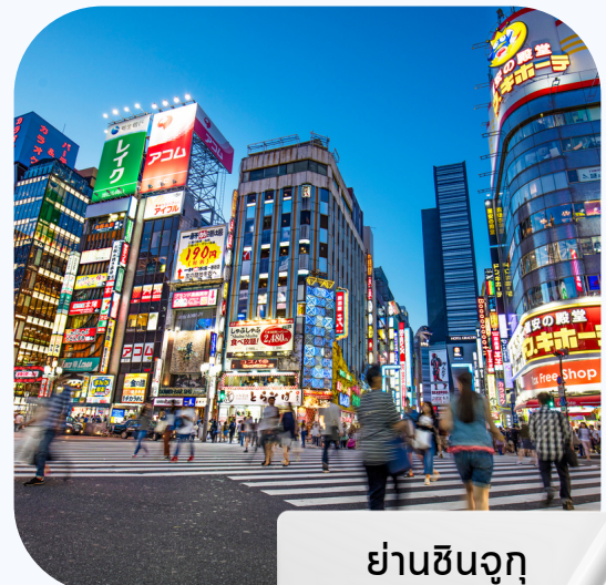
ย่านชินจุกุ