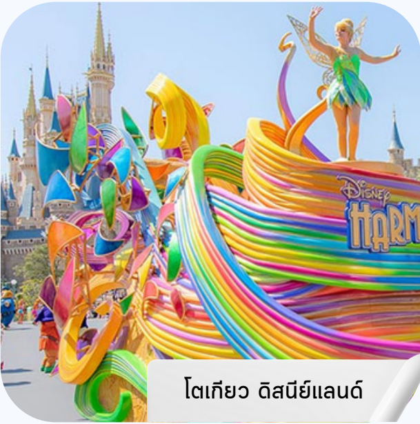
โตเกียว ดิสนีย์แลนด์