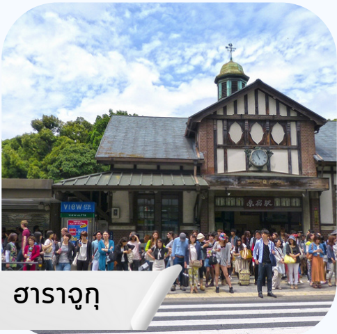
ฮาราจุกุ