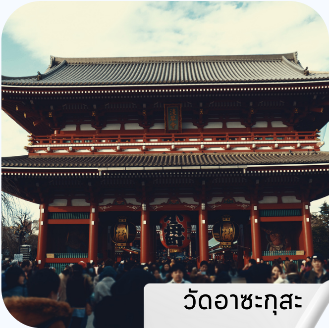
วัดอาชะกุสะ