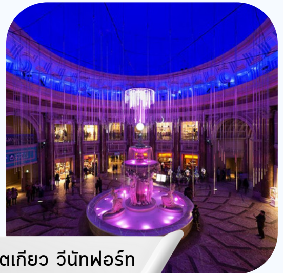
โตเกียว วิกท์ฟอรัท