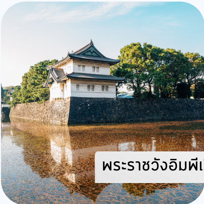
พระราชวังอิมพีเรียล