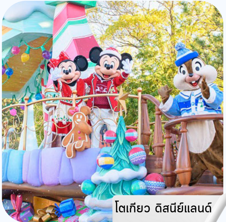
โตเกียว ดิสนีย์แลนด์