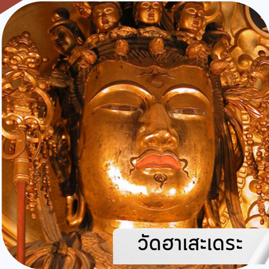
วัดฮาเสะเดระ