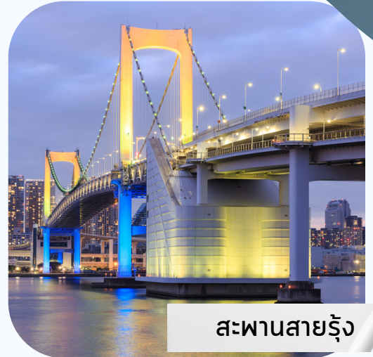
สะพานสายรุ้ง