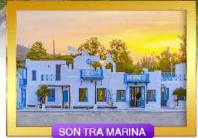
SON TRA MARINA