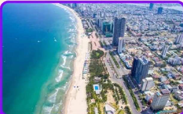
เช็คอิน ชายหาดหมีเคว เป็นชายหาดที่สวยงามที่สุดในเมืองดานัง