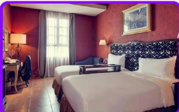
พักบนบานาฮิลล์ 1 คืน