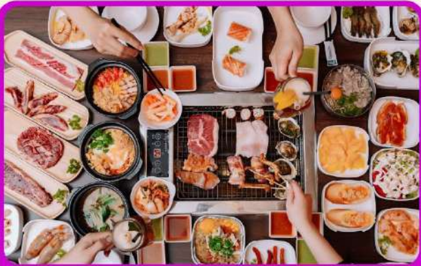
พิเศษ!! เมนูชาซีมิ+บุฟเฟ่ต์ปิ้งย่าง