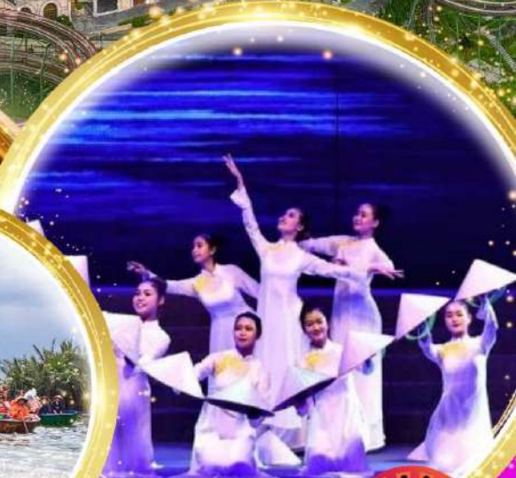
โชว์สุดอลังการ Charming at danang