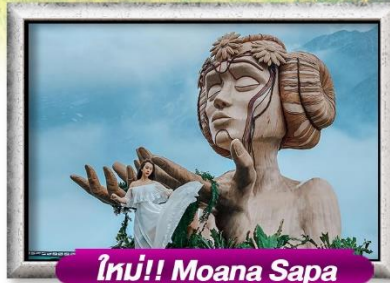
ใหม่!! Moana Sapa