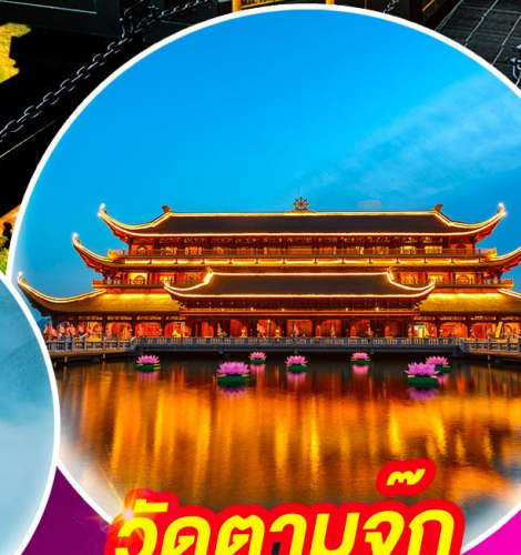
วัดตามจุก แลนด์มาร์กใหม่เวียดนาม

ชมนาขั้นบันได ซาปา หลังคาอินโดจีน นั่งรถรางและกระเช้าขึ้นเขา ฟานซิปัน สะพานแก้วมังกรเมฆ