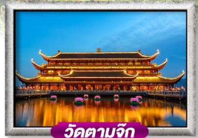
วัดตามจุก

เมนู สุดพิเศษ SEN BUFFET + ซาบูปลาแซลมอน + ไวน์แดง