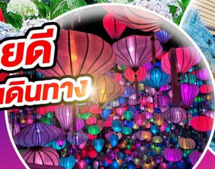
สวนแห่งแสง (Lumiere Light Garden)