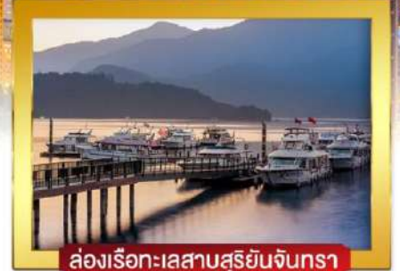
ล่องเรือทะเลสาบสุริยจันทร์