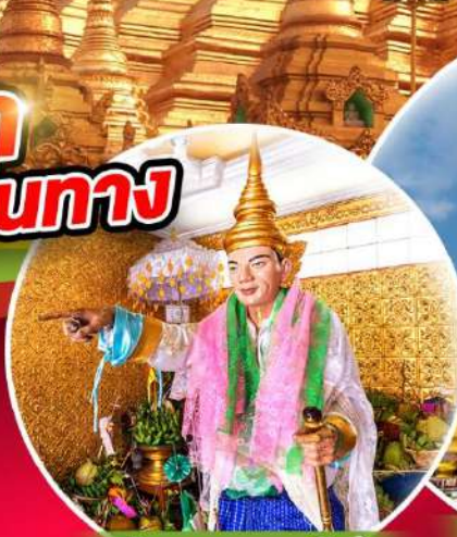
สักการะเทพทันใจ