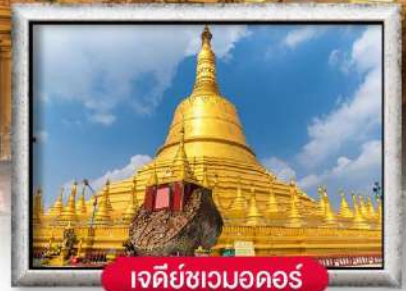
เจดีย์เขมอดอร์

เมนู สุดพิเศษ | กุ้งแม่น้ำเผา + บุฟเฟ่ต์นานาชาติ