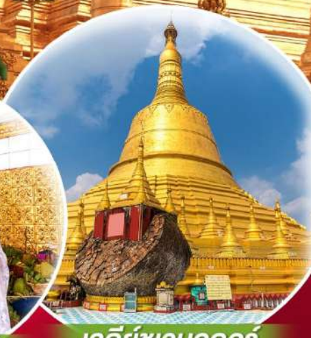
เจดีย์ชเวมอดอร์

สักการะ 3 มหาบูชาสถาน เจดีย์ชเวดากอง เจดีย์โบตาทาวน์ เจดีย์ชเวมอดอร์ พระธาตุนิรंतर์แขวน