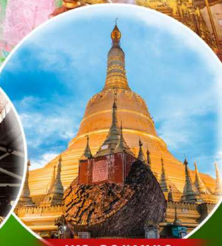
พระธาตุมุเตา