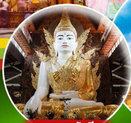
พระหงาทัดจี