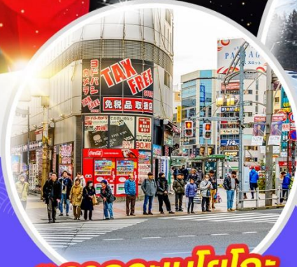
ตลาดอะเมโยโกะ