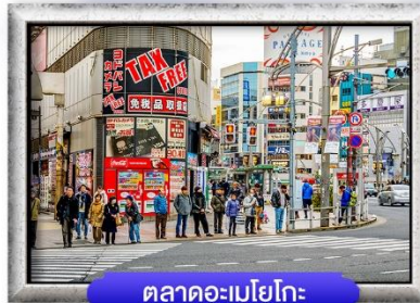
ตลาดอะเมโยโกะ