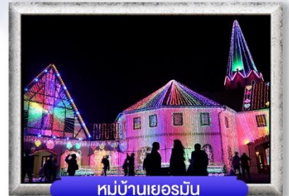
หมู่บ้านเยอรมัน

พิเศษ! บุฟเฟต์บั้งย่างยากินิกุ, บุฟเฟต์งาปู