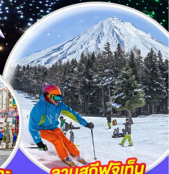
ลานสกีฟูจิเท็น