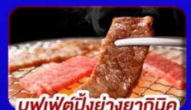
บุฟเฟ่ต์บึงย่างซากุระนิคุ