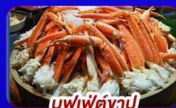
บุฟเฟ่ต์งาปู