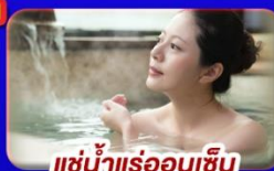
แช่น้ำแร่ร้อนเซ็น

เทศกาลประดับไฟหมู่บ้านเยอรมันแห่งโตเกียว