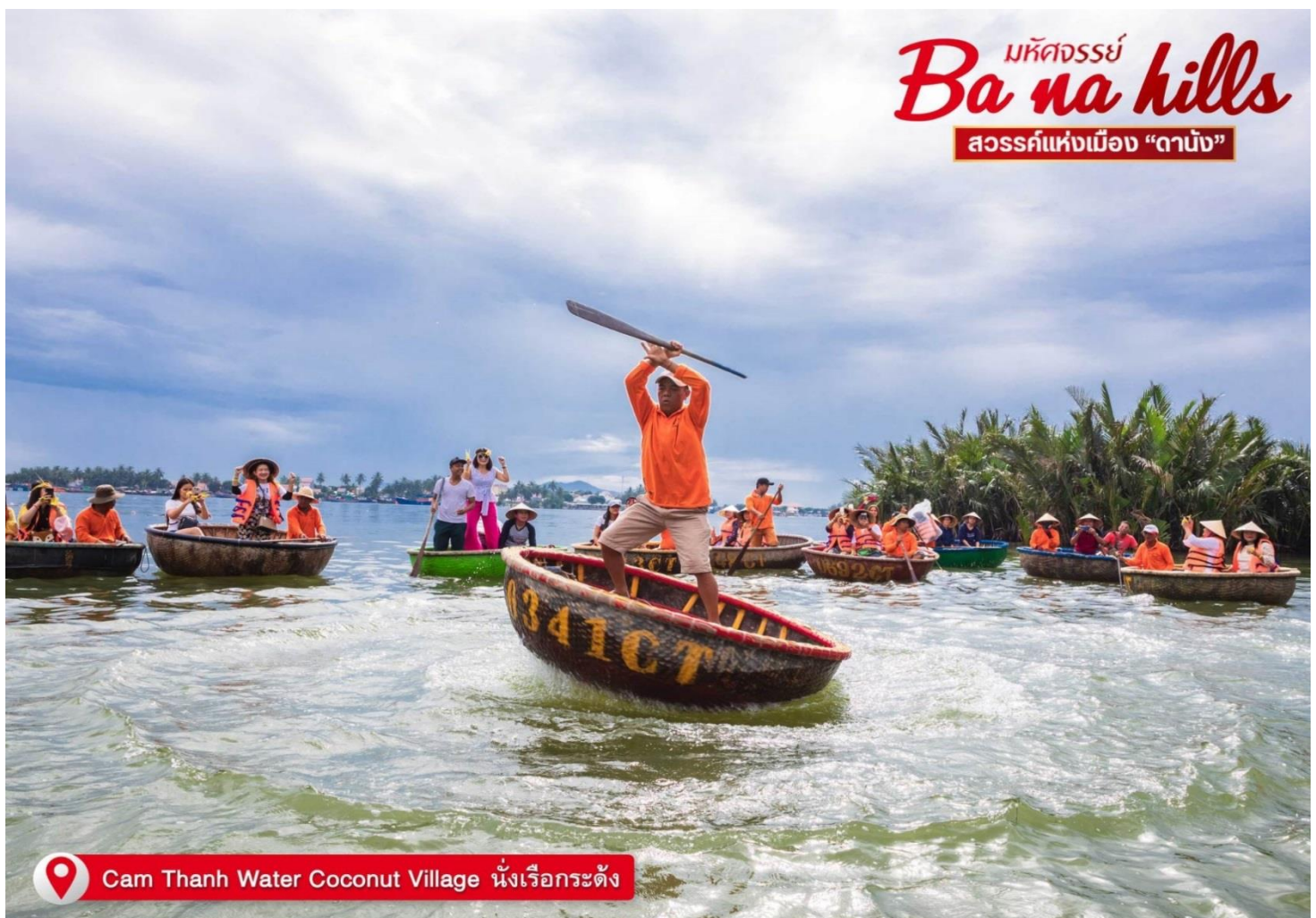
Cam Thanh Water Coconut Village นั่งเรือกระดัง

จากนั้น นำท่านเดินทางสู่ หมู่บ้านกัมทาน สนุกสนานไปกับกิจกรรม!! นั่งเรือกระดัง Cam Thanh Water Coconut Village หมู่บ้านเล็กๆในเมืองฮอยอันตั้งอยู่ในสวนมะพร้าวริมแม่น้ำ ในอดีตช่วงสงครามที่นี่เป็นที่พักอาศัยของเหล่าทหาร อาชีพหลักของคนที่นี่คืออาชีพประมง ระหว่างการล่องเรือท่านจะได้ชมวัฒนธรรมอันสวยงาม ชาวบ้านจะขับร้องเพลงพื้นเมือง ผู้ชายกับผู้หญิงจะหยอกล้อกันไปมาหน้าที่พายเรือมาเคาะกันเป็นจังหวะดนตรีสุดสนุกสนาน (ไม่รวมค่าทิปให้แก่คนพายเรือ ท่านละ 40 บาท/ต่อท่าน/ต่อทริป)