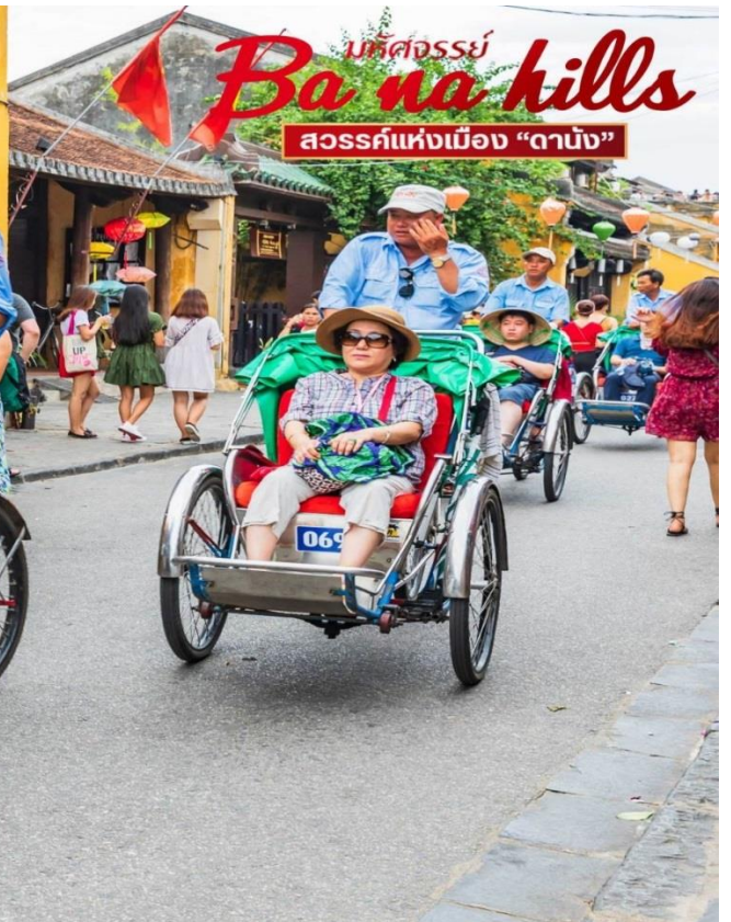
มัทคองส์ Ba na hills สวรรค์แห่งเมือง "ดานัง"

เที่ยง 🍽️ บริการอาหารกลางวัน ณ ภัตตาคาร (SEA FOOD)