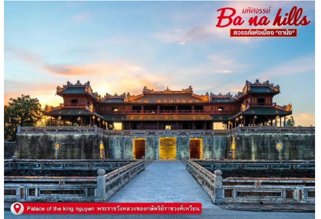
Palace of the king nguyen พระราชวังหลวงของกษัตริย์ราชวงศ์เหงียน

🍽️ บริการอาหารเช้า ณ ห้องอาหารโรงแรม นำท่านเยี่ยมชม พระราชวังหลวงของกษัตริย์ราชวงศ์เหงียน พระราชวังแห่งนี้สร้างขึ้นในปี พ.ศ. 2348 ในสมัยยาลอง เคยเป็นที่ประทับของพระมหากษัตริย์ราชวงศ์เหงียน 13 พระองค์ พระราชวังแห่งนี้ตั้งอยู่ใจกลางเมืองเป็นมรดกตกทอดอันยิ่งใหญ่และงดงามแห่งนี้ได้ถูกสร้างขึ้นตามแบบแผนความเชื่อของจีน