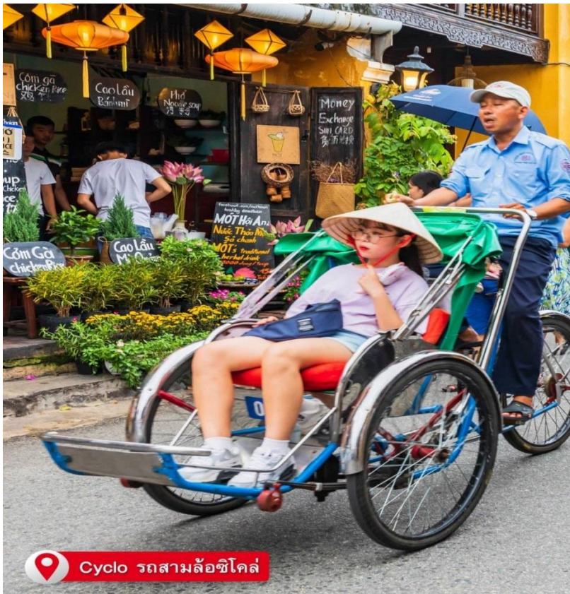
Cyclo รถสามล้อซีโคล

พิเศษ!! นำท่านนั่งรถสามล้อซีโคล (Cyclo) ชมเมืองเว้ ซึ่งเป็นจุดเด่นและเอกลักษณ์ของเวียดนาม (ไม่รวมค่าทิปคนขี่สามล้อ ท่านละ 40 บาท/ต่อท่าน/ต่อทริป)