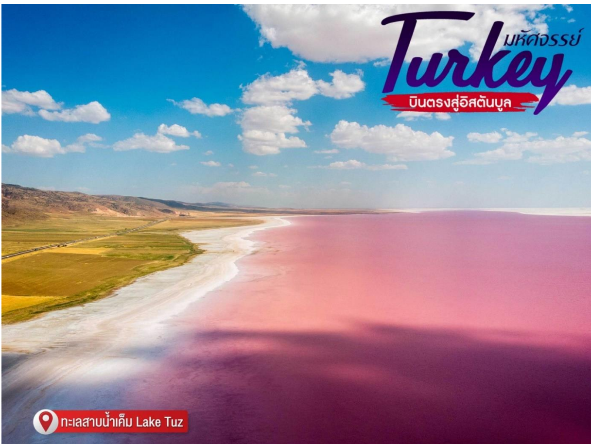
📍 ทะเลสาบน้ำเค็ม Lake Tuz

แวะถ่ายรูป ทะเลสาบน้ำเค็ม Lake TuzTuzGolu ) ทะเลสาบน้ำเค็มที่ใหญ่เป็นอันดับสองของตุรกี เมื่อหน้าร้อนมาถึงน้ำจะเหือดแห้งเหลือแต่เพียงเกลือกองเป็นแผ่นหนาหลายสิบล้านเมตร มองเห็นเป็นพื้นสีขาวสุดลูกหูลูกตา และยังคงเคยเป็นสถานที่ถ่ายทำหนัง Star War อีกด้วย