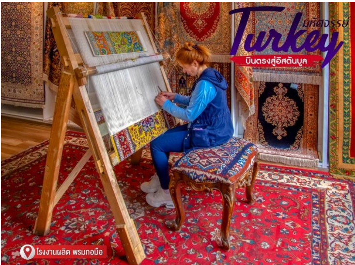
โรงงานผลิต พรมทอมือ