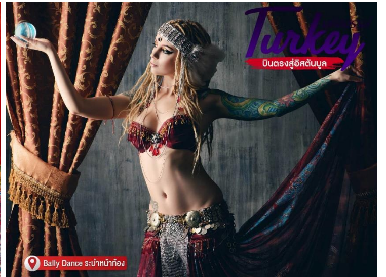
Bally Dance รับประทานอาหาร

สายด่วน ขวนเที่ยว ให้บริการตั้งแต่ 06.00 - 23.00 น. ทุกวัน ไม่เว้นวันหยุด นอกเวลา สามารถฝากข้อความในไลน์ @paradiseintertour เจ้าหน้าที่จะตอบกลับโดยเร็วที่สุด