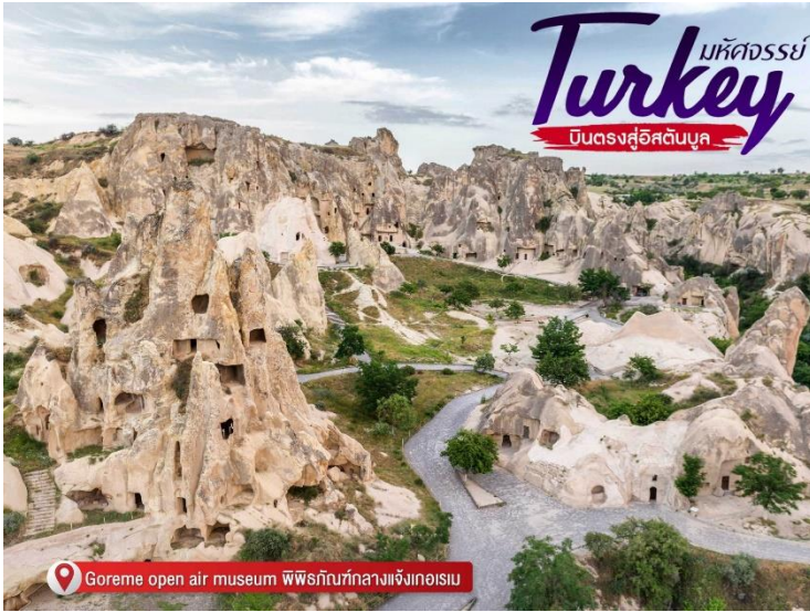
Goreme open air museum พิพิธภัณฑ์กลางแจ้งเกอริเม