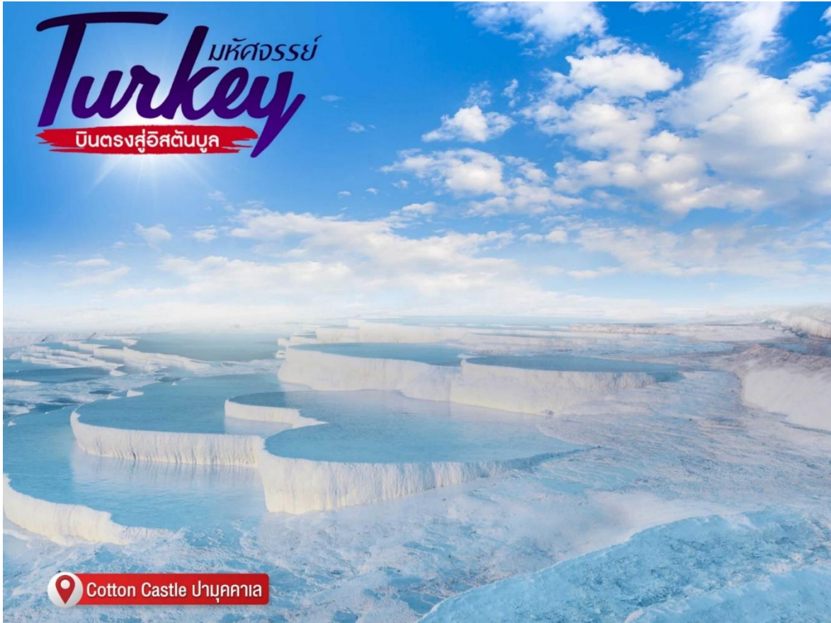
Cotton Castle ปานุกคาธา