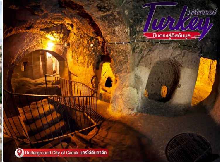
Underground City of Caduk นครใต้ดินคาดัค