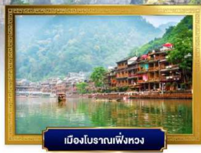
เมืองโบราณฟิงหวง