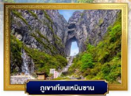
ภูเขาเทียนเหมินซาน