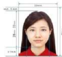
Paper Photo for Visa Application Form