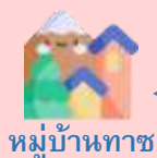
หมู่บ้านทาช

เที่ยง บริการอาหารกลางวัน ณ ภัตตาคารอาหารจีน (7)