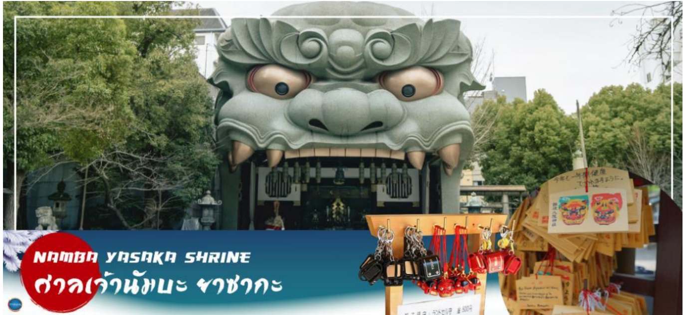
NAMBA YASAKA SHRINE ศาลเจ้านัมมะ ยะซากะ

นำทุกท่านเช็คอินจุดถ่ายรูปที่ ศาลเจ้านัมมะ ยะซากะ (Namba Yasaka Shrine) ตั้งอยู่ในย่านนัมมะของเมืองโอซาก้า ไฮไลท์ของศาลเจ้าแห่งนี้ คือรูปปั้นหน้าสิงโตอ้าปากขนาดใหญ่ ที่เชื่อกันว่า สามารถกลืนกินปีศาจร้าย หรือ สิ่งไม่ดีทั้งหลาย ให้หายไป และนำพามาซึ่งความโชคดีให้แก่ผู้คน ปัจจุบันนักเรียน นักศึกษา และผู้ประกอบการธุรกิจนั้น นิยมมาขอพรให้ประสบความสำเร็จกันที่นี่ ด้วยความสูง 17 เมตร ความกว้าง 11 เมตรและความลึก 7 เมตร อีสระให้ทุกท่านสักการะ และเก็บภาพที่ ศาลเจ้านัมมะ ยะซากะ