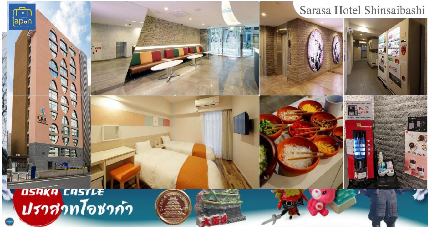
Sarasa Hotel Shinsaibashi

SARASA HOTEL SHINSAIBASHI หรือเทียบเท่าระดับเดียวกัน