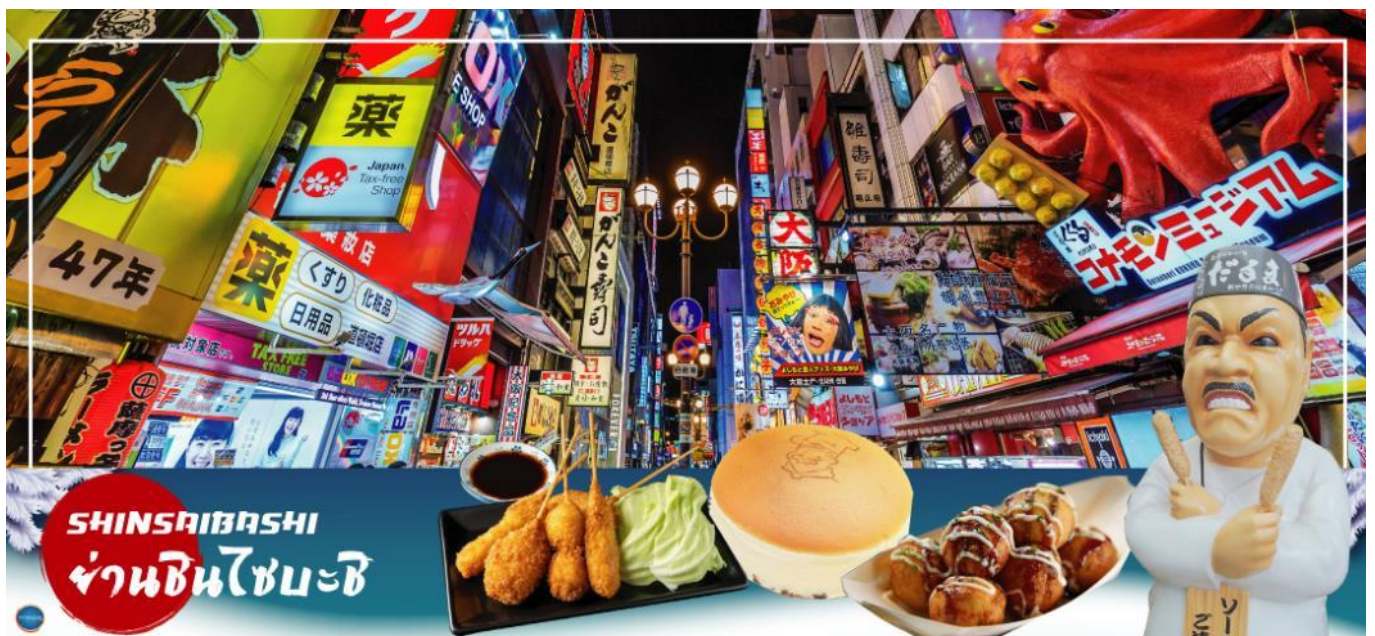
SHINSAIBASHI ย่านชินไซบาชิ

จากนั้นอีสระขอปิ้ง ย่านชินไซบาชิ (Shinsaibashi) บริเวณแหล่งช้อปปิ้งแห่งนี้มีความยาวประมาณ 600 เมตร เต็มไปด้วยร้านค้าปลีก ร้านแฟชั่นร้านเครื่องสำอางค์ ร้านรองเท้า กระเป๋า นาฬิกา ร้านกาแฟ ร้านอาหาร ร้านขนม ร้านเสื้อผ้าสตรีทแบรนด์ตั่งญี่ปุ่นและต่างประเทศ เช่น Zara H&M Beans ABC Mart เป็นต้น เรียกว่ามีทุกอย่างที่ต้องการรวมกันอยู่บริเวณนี้ ใกล้กันท่านสามารถเดินไปยัง ย่านโดทงโบริ (Dotonbori) ย่านบันเทิงยามค่ำคั่นตลอดแนวถนนเลียบบคลองโดทงโบริ จากสะพานโดทงโบริบาชิไปจนถึงสะพานนิปปอนบาชิ ไฮไลท์!!! ใครๆ ก็เช็คอิน ถ่ายภาพคู่ ป้ายกูลิโกะแมน หรือ ป้ายโดทงโบริกูลิโกะ (Dotonbori Glico Sign) เป็นป้ายไฟนีออนรูปนักกรีฑา