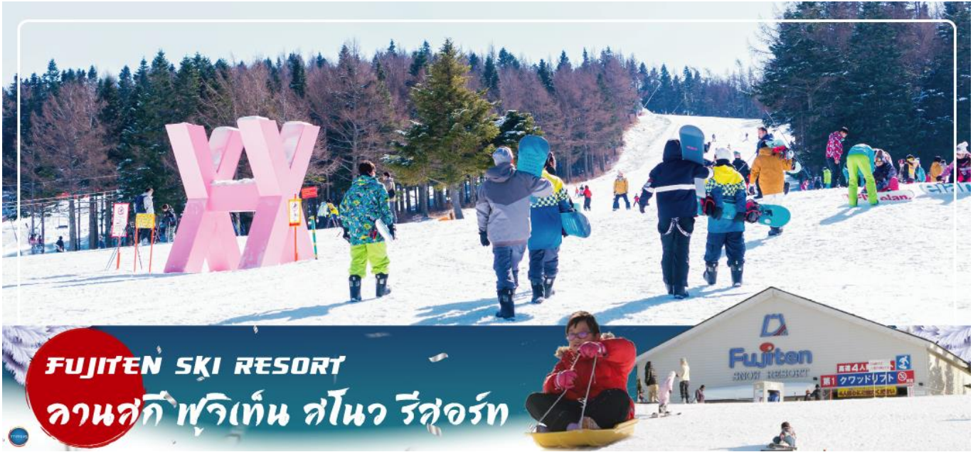
FUJITEN SKI RESORT ลานสกี ฟุจิเท็น สโนว รีสอร์ท

วันที่สาม สัมผัสหิมะ ณ ลานสกี ฟุจิเท็น สโนว รีสอร์ท หรือ จุดชมวิวชั้น 5 ภูเขาไฟฟูจิ (ขึ้นอยู่กับสภาพอากาศ) – พิธีชงชาญี่ปุ่น – หมู่บ้านโอชิโนะสั๊กไก – กรุงโตเกียว – ย่านโอไดบะ – ห้างไดเวอร์ซิตี – เมืองนาริตะ