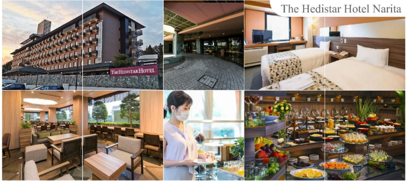
The Hedistar Hotel Narita