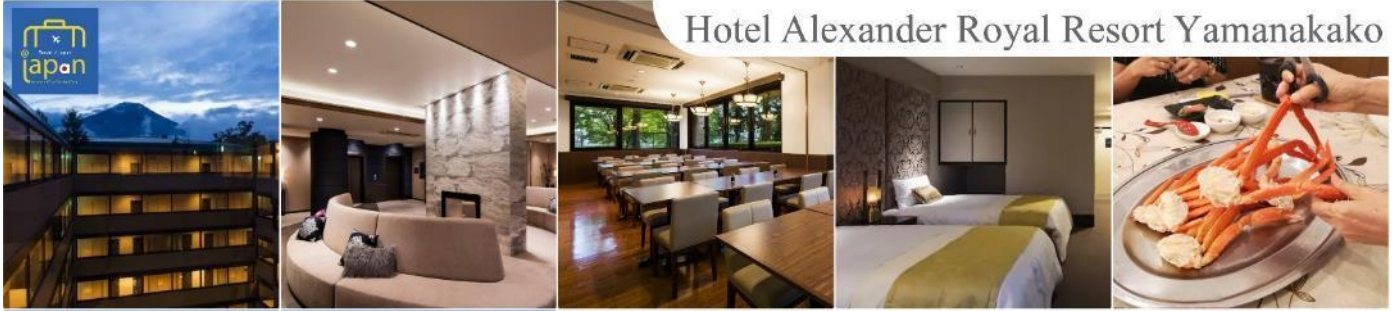
Hotel Alexander Royal Resort Yamanakako

หลังอาหารให้ท่านได้ผ่อนคลายกับการแช่น้ำแร่ธรรมชาติ เชื่อว่าถ้าได้แช่น้ำแร่แล้ว จะทำให้ผิวพรรณสวยงามและช่วยให้ระบบหมุนเวียนโลหิตดีขึ้น