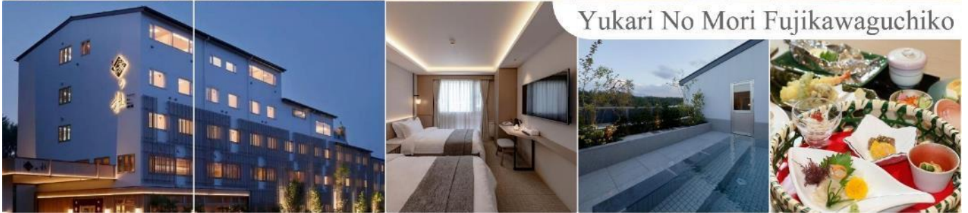
Yukari No Mori Fujikawaguchiko

วันที่สาม สัมผัสหิมะ ณ ลานสกี ฟุจิเท็น สโนว รีสอร์ท หรือ จุดชมวิวชั้น 5 ภูเขาไฟฟูจิ (ขึ้นอยู่กับสภาพอากาศ) – พิธีชงชาญี่ปุ่น – หมู่บ้านโอชิโนะสั๊กไก – กรุงโตเกียว – ย่านโอไดบะ – ห้างไดเวอร์ซิตี – เมืองนาริตะ