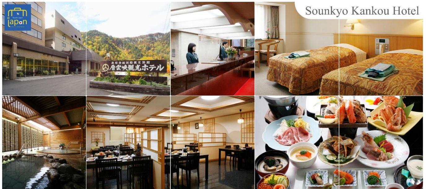
Sounkyo Kankou Hotel

หลังอาหารให้ท่านได้ผ่อนคลายกับการแช่น้ำแร่ธรรมชาติ เชื่อว่าถ้าได้แช่น้ำแร่แล้ว จะทำให้ผิวพรรณสวยงามและช่วยให้ระบบหมุนเวียนโลหิตดีขึ้น