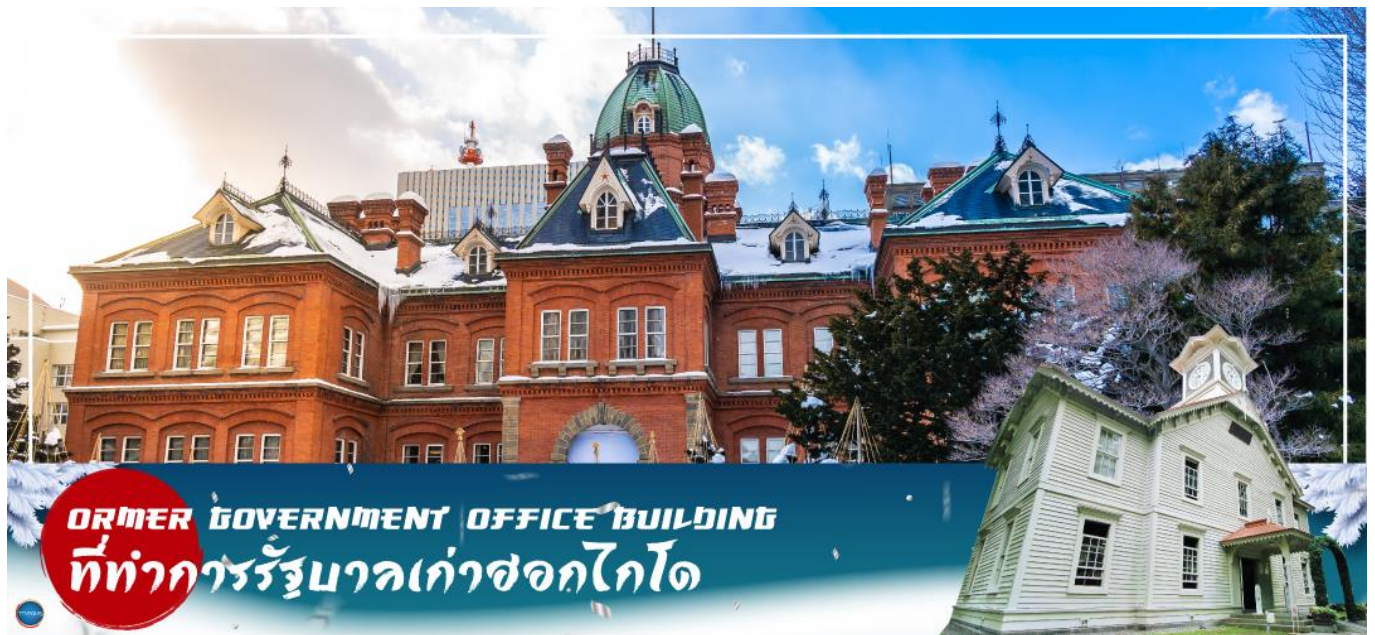
FORMER GOVERNMENT OFFICE BUILDING ที่ทำการรัฐบาลเก่าซอกไกโด

เมืองซัปโปโร – ศาลาว่าการเมืองซอกไกโดหลังเก่า (ด้านนอก) – ผ่านชม หอนาฬิกาเมือง – มิตซึเอาท์เล็ทพาร์ค – ถนนช้อปปิ้งทานุกิโคจิ