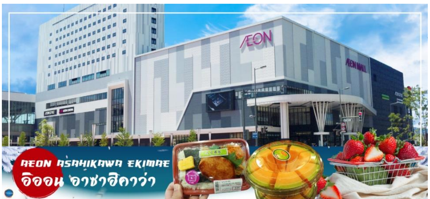
AEON ASAHIKAWA EKIMAE อ็อน อาซาฮิดาคาว่า

จากนั้นนำท่านออกเดินทางสู่ เมืองโซฮุนเคียว (ใช้เวลาเดินทางประมาณ 1.30 ชั่วโมง)