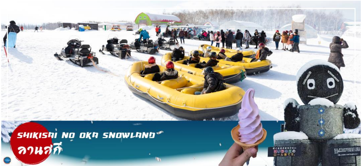
SHIKISAI NO OKA SNOWLAND ลานสกี

นำท่านสู่ ลานสกีซิดิไซพานอราฆ่า (Shikisai no oka) (ใช้เวลาเดินทางประมาณ 1 ชั่วโมง) เนินที่ราบกว้างใหญ่ที่มีโรลคองและโรลจิ่ง เป็นหุบฟางขนาดใหญ่ ซึ่งเป็นสัญลักษณ์ของลานสกีแห่งนี้ ท่านสามารถสนุกสนานกับลานกิจกรรมที่มีบริการอยู่ที่นี่ ทั้งแบบ Snow Raft เรือยางขนาดใหญ่ที่สามารถนั่งเป็นกลุ่ม หรือเดี่ยว ไหลลงจากเนินตามเนินเขาที่กำหนด และยังมี Banana Boat ที่ลากด้วยสโนว์โมบิลที่ลากซิกแซกตามสันเนินสร้างความสนุกสนานตื่นเต้นได้มากเลยทีเดียว และ Sled สำหรับพาหนะส่วนตัว ที่ไหลลงจากเนินสูง (**หมายเหตุ ราคาไม่รวมค่าเล่นกิจกรรมต่างๆ ค่าเช่าชุดและอุปกรณ์สกี กรณีลานสกีปิด บริษัทสงวนสิทธิ์ นำลูกค้าไปลานสกีอื่นแทนได้ตามความเหมาะสมกับสถานการณ์)