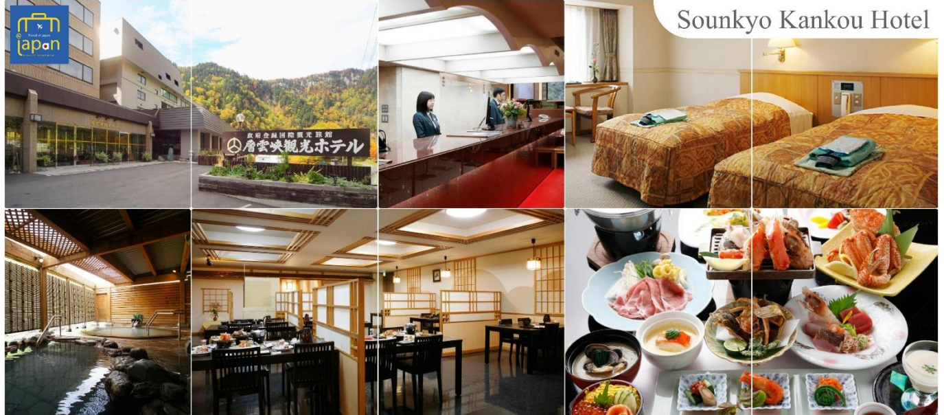
Sounkyo Kankou Hotel

หลังอาหารให้ท่านได้ผ่อนคลายกับการแช่น้ำแร่ธรรมชาติ เชื่อว่าถ้าได้แช่น้ำแร่แล้ว จะทำให้ ผิวพรรณสวยงามและช่วยให้ระบบหมุนเวียนโลหิตดีขึ้น