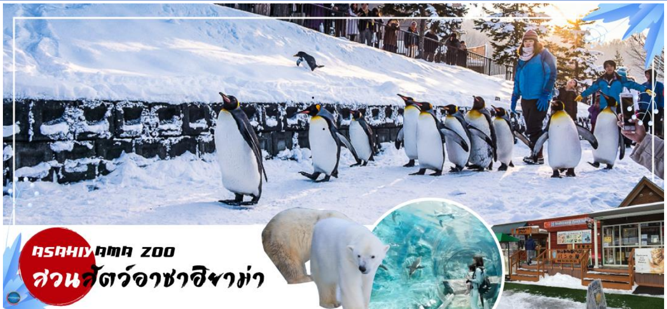
Asahiyama Zoo สวนสัตว์อาซาฮิยาม่า

วันที่สี่ เมืองอาซาฮิกาวา – สวนสัตว์อะซาฮิยาม่า – หมู่บ้านราเมงอะซาฮิยาม่า – หมู่บ้านเพนินาย นิงเกิ้ลเทอเรส – เมืองซัปโปโร