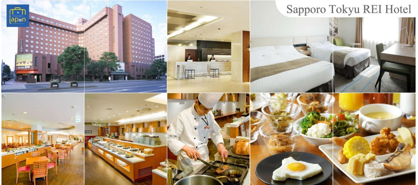
Sapporo Tokyu Rei Hotel

รับประทานอาหารเย็น ณ ภัตตาคาร (8) พิเศษ!!! เมนู นูฟเฟดปังย่าง + ชาปู SAPPORO TOKYU REI HOTEL หรือเทียบเท่าระดับเดียวกัน