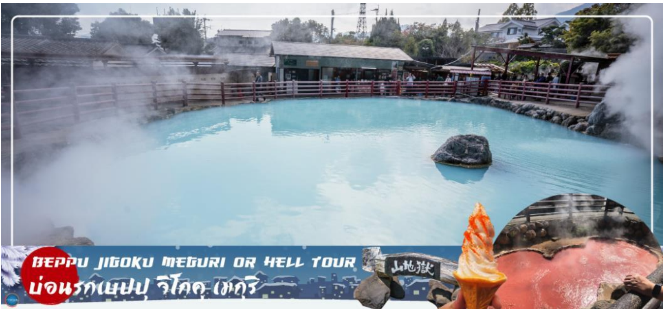
BEPPU JIGOKU MEGURI OR HELL TOUR บ่อนรกเบปปุ จิโกค เมกुरิ

บ่อนรกเบปปุ จิโกค เมกुरิ (เข้าชม 2 บ่อ) - เมืองยุฟูอิน - หมู่บ้านยุฟูอินฟลอรัล - ทะเลสาบคิริน - เมืองฟุกุโอกะ - ศาลเจ้าดะไซฟุเทมมังกุ - ดิวตี้ฟรี - กันดั้ม ปาร์ค ฟุกุโอกะ