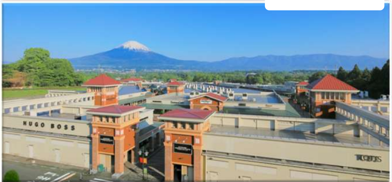
โกเทมบะพรีเมียมเอาร์ท

นำท่านสู่ โกเทมบะพรีเมียมเอาร์ท ช้อปปิ้งมอลล์ที่ใหญ่ที่สุดในญี่ปุ่น แหล่งช้อปปิ้งยอดนิยมประจำสถานที่ท่องเที่ยวรอบแนวภูเขาไฟฟูจิ ภายในมีร้านค้าแบรนด์เนมกว่า 210 ร้าน ศูนย์อาหารอีก 23 แห่ง ซึ่งแวดล้อมไปด้วยภูมิทัศน์ทางธรรมชาติสวยๆ ทั้งทะเลสาบ สวนดอกไม้ และภูเขาไฟฟูจิ