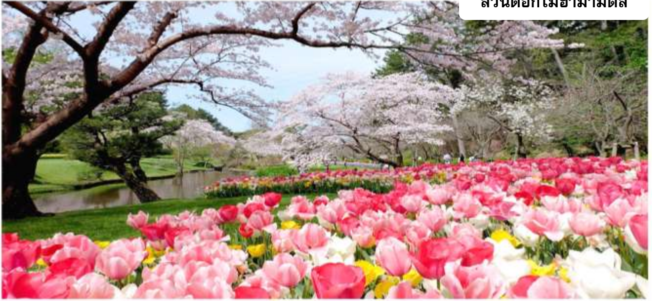
สวนดอกไม้ฮามามัตสึ

สวนดอกไม้ฮามามัตสึ สวนพฤกษศาสตร์ที่อยู่ติดกับทะเลสาบฮามานะ มีทัศนียภาพธรรมชาติที่สวยงามและเต็มไปด้วยดอกไม้พืชพันธุ์กว่า 3,000 ชนิด รวมถึงต้นซากุระ 1,300 ต้น และทิวลิป 5 แสนดอก นอกจากนี้ยังมี "สวนดอกกุหลาบ" กว่า 1000 ต้น และ "สวนฮานะชิโอะ" ที่เต็มไปด้วยพรรณไม้ญี่ปุ่นกว่า 1 ล้านต้น อีกทั้งยังสามารถชมดอกไม้หน้านาพันธุ์ตามฤดูกาล เช่น ในฤดูใบไม้ร่วงก็สามารถชมโมมิจิ(ใบไม้แดง)ได้