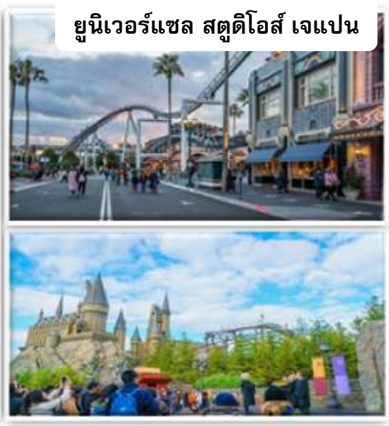
ยูนิเวอร์แซล สตูดิโอส์ เจแปน