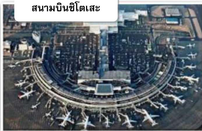
สนามบินซีโตเสะ

เวลา 02.05 น. ออกเดินทางสู่ สนามบินซีโตเสะ ประเทศญี่ปุ่น โดย สายการบินไทยแอร์เอเชียเอ็กซ์ เที่ยวบินที่ XJ 620