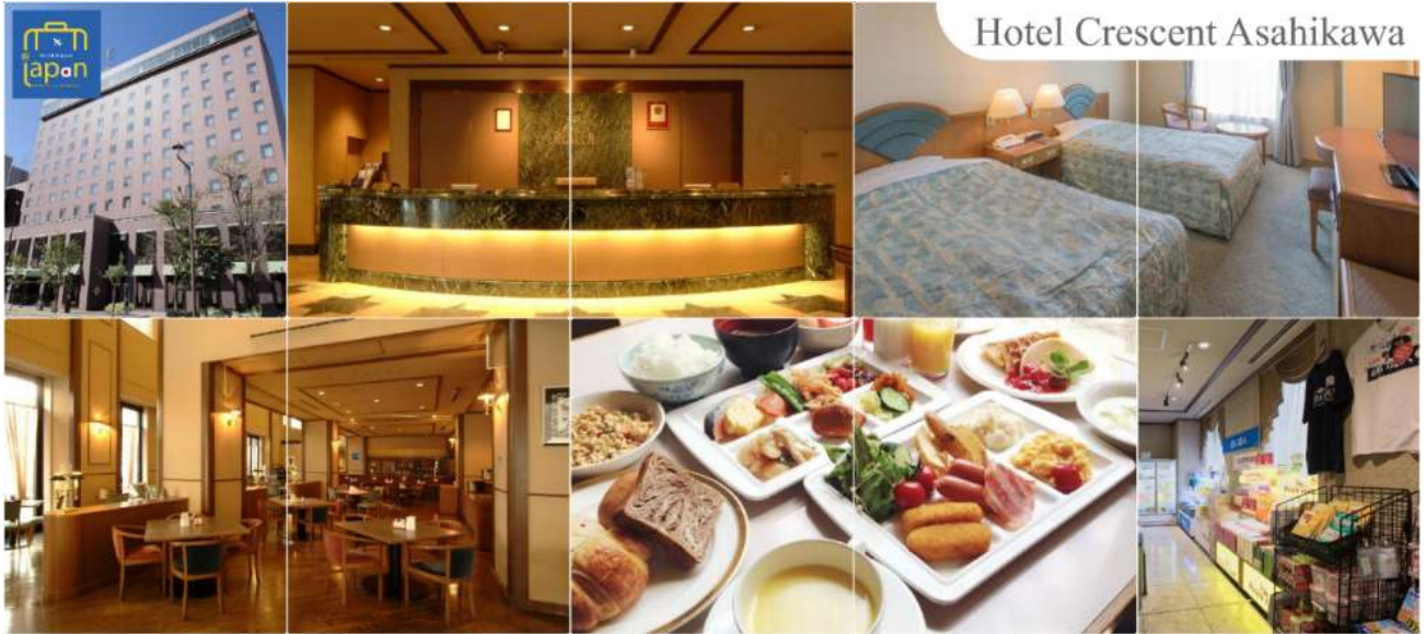
Hotel Crescent Asahikawa