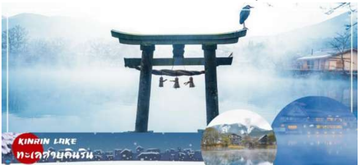
KIRIN LAKE ทะเลสาบคิริน

นำท่านสู่ บ่อนรกเบปปุ จิโกคุ เมกุริ (Beppu Jigoku Meguri Or Hell Tour) หรือบ่อน้ำพุร้อน ขุนนรกทั้งแปด เป็นบ่อน้ำพุร้อนธรรมชาติที่เกิดขึ้น ภายหลังจากการระเบิดของภูเขาไฟ ประกอบไปด้วยแร่ธาตุที่เข้มข้น เช่น กำมะถัน แร่เหล็ก โซเดียม คาร์บอนเนต เรเดียม เป็นต้น และร้อนเกินกว่าจะลงไปอาบได้ แล้วบ่อทั้ง 8 บ่อ ก็ตั้งชื่อให้ยากแล้วตามลักษณะภายนอกที่เห็น (ให้ท่านเข้าชม 2 บ่อ) นำท่านสู่ เมืองยฟูอิน (Yufuin) เมืองเล็กๆ ในจังหวัดโออิตะ (Oita) ที่รู้จักกันดีในฐานะแหล่งออนเซ็นชื่อดัง และที่นี่ก็เต็มไปด้วยสถานที่น่ารักๆ มีถนนที่เรียงรายไปด้วยคาเฟ่และร้านขายของเก่า ของกระจุกกระจิกมากมาย ระหว่างทางไม่ควรพลาดที่จะแวะ ยฟูอินฟลอรัลวิลเลจ (Yufuin Floral Village) ชมปาร์คในบรรยากาศแห่งเทพนิยายที่ดูราวกับกำลังหลงเข้าไปในเหมือนจำลองหมู่บ้านสไตล์ยุโรป ร้านค้าทุกหลังเป็นสีเหลืองที่มีแต่ร้านที่มีสินค้าเป็นเอกลักษณ์ !!! ไฮไลท์ ประจำเมืองยฟูอิน บ้านอิฐที่แสนคลาสสิกเรียงรายอยู่บนถนนสายเล็กๆ ประดับประดาไปด้วยดอกไม้บานาชนิด ภายในหมู่บ้านมีถนนช้อปปิ้ง มีร้านรวงต่างๆ ที่ตกแต่งได้อย่างน่ารัก ร้านไอศกรีม หรือ คาเฟ่น่ารักๆ อย่าง Alice Tea คาเฟ่สุดชิคบรรยากาศเหมือนอยู่ในป่าและจับน้ำชากับ Mad Hatter หรือจะเป็นร้านขนม ที่มีเค้าโครงมาจาก Kiki's Delivery Service กลิ่นหอมของขนมปังอบอวล น่ากินสุดๆ นอกจากนี้ยังมี จุดพักผ่อนให้แฮงเอาท์อีกมากมาย เดินเลยจากถนนช้อปปิ้งไป ท่านจะได้พบความงามของ ทะเลสาบคิริน (Kirin Lake) น้ำทะเลสาบใสเห็นตัวปลาแหวกว่ายในผืนน้ำ บางช่วงมีหมอกบางๆ ลง นับว่าคุ้มค่ากับการมาเห็นความงามนี้ด้วยตาตัวเองสักครั้งนึงอย่างแน่นอน อิสระให้ท่านเดินเล่นและถ่ายรูปตามอัธยาศัย