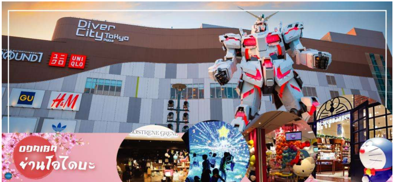
หุ่นยนต์กันดั้ม ขนาดเท่าของจริง ซึ่งมีขนาดใหญ่มาก ในบริเวณห้างอิสระช้อปปิ้งตามอัธยาศัย

จากนั้นเดินทางสู่ ย่านโอไดบะ ( Odaiba) (ใช้เวลาเดินทางโดยประมาณ 30 นาที)เมืองคือเกาะที่สร้างขึ้นไว้เป็นแหล่งช้อปปิ้ง และแหล่งบันเทิงต่างๆ ในอ่าวโตเกียว ได้รับการปรับปรุงให้มีชื่อเสียงและเป็นที่ยอมรับในช่วงหลังของปี 1990 นอกจากนี้มีสถาปัตยกรรมที่สวยงามตั้งอยู่มากมายแล้ว แต่ก็ยังคงความเป็นธรรมชาติไว้ด้วยความอุดมสมบูรณ์ของพื้นที่สีเขียว โดเวอร์ซิตี โตเกียว พลาซ่า (Diver City Tokyo Plaza) เป็นห้างดังอีกห้างหนึ่ง ที่อยู่บนเกาะ โอไดบะ จุดเด่นของห้างนี้ก็คือ