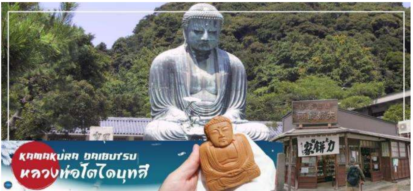
KAMAKURA DAIBUTSU หลวงพ่อดิโอบุทสึ

เมืองคามาคุระ – พระใหญ่ไดบุทสึ คามาคุระ – ถนนโคมาจิโดริ – ศาลเจ้าสีรุ้งโอะกะกะ สะจิมัง – ย่านโอไดบะ – ห้างไดเวอร์ซิตี – เมืองนาริตะ-อโอง มอลล์