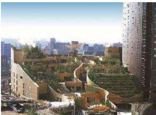
ห้ามพลาด

• ย่านชินเซไก (Shinsekai) ที่แปลตรงตัวได้ว่าโลกใหม่เป็นย่านแสงสียามค่ำคืนของเมืองโอซาก้ามีบรรยากาศแบบย้อนยุคสไตล์เรโทรเป็นแหล่งรวมร้านอาหารขึ้นชื่อของโอซาก้าอย่างคิซิดะซึซึซึ่งเป็นอาหารเสียบไม้แล้วชุบแป้งทอดมีถนนแคบๆที่เรียกว่าจันจันโยโกะโช (Jan Jan Yokochō) ที่เป็นแหล่งรวมร้านกินดื่มสำหรับคนญี่ปุ่นร้านรวงต่างๆจะเปิดไฟสีแสบสันเรียกแขกอย่างคึกคักมีอาหารมีขนมและกับแกล้มให้ลองชิมกันมากมายยังมีร้านขายของที่ระลึกให้เลือกช้อปปิ้งกันอีกหลายร้านหลายคนที่ไม่ไปที่นี่จะพบเห็นหุ่นคล้ายลิงนั่งยิ้มตามมุมต่างๆนั้นก็คือนิลลิเคน (Billikan) หรือเทพแห่งโชคกลางนั่นเอง ไฮไลท์!!! หอคอยซึเทนคาคุ (Tutenkaku) สัญลักษณ์ของย่านชินเซไกซึ่งตั้งอยู่ตรงกลางย่านชินเซไกนั่นเอง