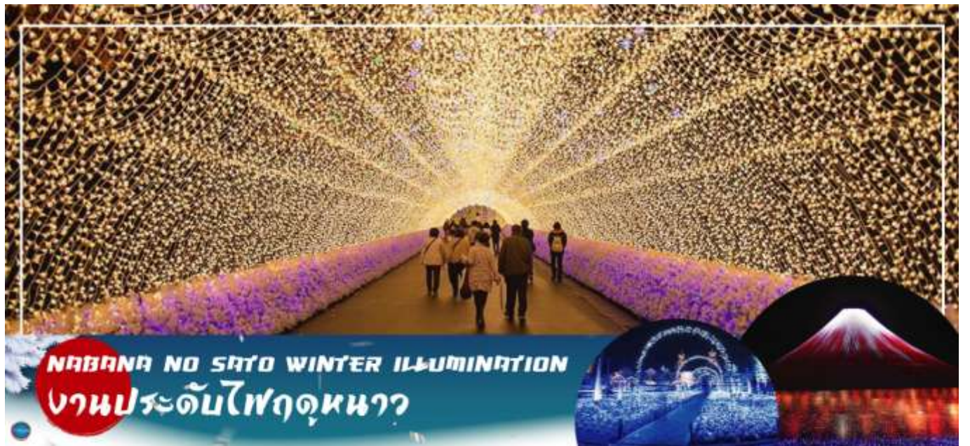
เก็บภาพประทับใจกลับไปอย่างมากมาย

จากนั้นนำท่านชม งานประดับไฟฤดูหนาว หมู่บ้านนาบานะ โนะ ซาโตะ (Nabana no Sato Winter Illumination) เป็นธีมพาร์คสวนดอกไม้ที่มีทุ่งดอกไม้ให้ชมตลอดทั้ง 4 ฤดูกาลสามารถเที่ยวได้ตลอดทั้งปี ไฮไลท์!!! การประดับไฟขนาดใหญ่ที่สุดในญี่ปุ่น จะมีในช่วงฤดูใบไม้ร่วงตลอดจนถึงปลายฤดูหนาว (ตุลาคม-มีนาคม) จะได้รับความนิยมมากเป็นพิเศษเนื่องจากการแสดงไฟในหลากหลายรูปแบบไม่ว่าจะเป็นอุโมงค์แสงไฟ (Tunnel of Light) หรือการประดับไฟในน้ำ (Water Illumination) อิสระให้ท่านได้เพลิดเพลินกับบรรยากาศงานประดับไฟที่ไม่ว่าจะหันไปทางไหนก็มีมุมให้