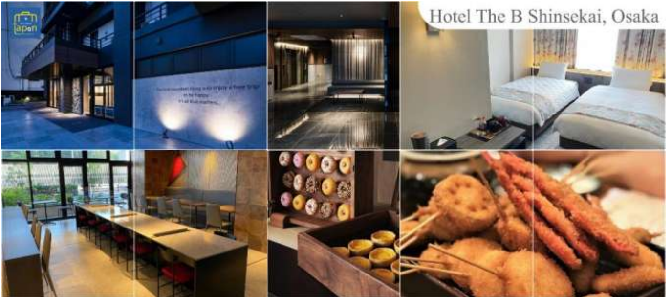
Hotel The B Shinsekai, Osaka

พักที่ HOTEL THE B SHINSEKAI, OSAKA หรือเทียบเท่าระดับเดียวกัน