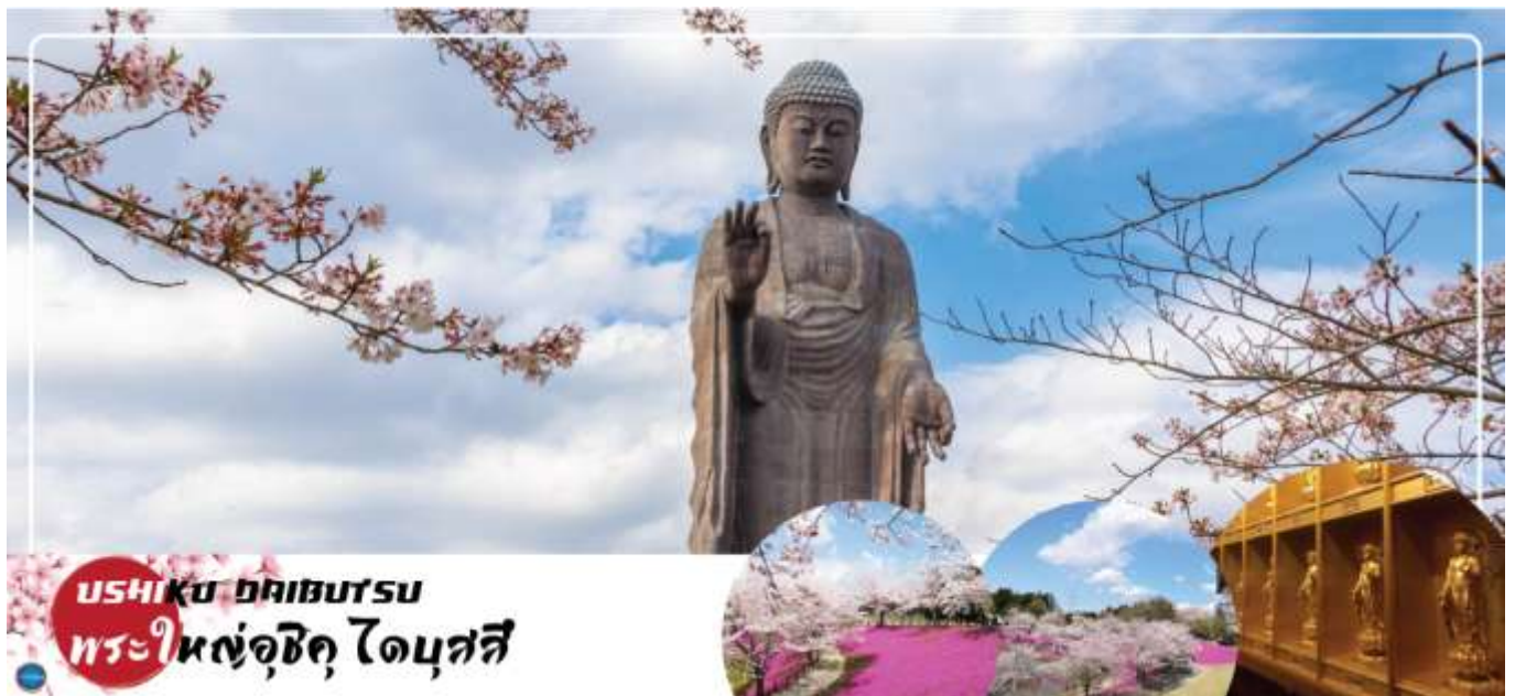
USHIKU DAIBUTSU พระใหญ่อุซึกุ ไดบุตสึ

นำท่านนมัสการ พระใหญ่อุซึกุไดบุตสึ (Ushiku Daibutsu) (ใช้เวลาเดินทางประมาณ 50 นาที) เป็นพระพุทธรูปปางยืนที่สูงที่สุดของประเทศญี่ปุ่นและเคยเป็นรูปปั้นที่สูงที่สุดในโลกที่ถูกบันทึกไว้โดยหนังสือบันทึกสถิติโลกกินเนสบุ๊ค (Guinness Book of world records) เมื่อปีค.ศ. 1995 ด้วยจากความสูงถึง 120 เมตรทำให้สามารถมองเห็นได้ตั้งแต่ใจกลางเมืองโตเกียวเลยทีเดียวที่เดียวสามารถเข้าไปยังบริเวณภายในรูปปั้นและขึ้นไปยังจุดที่เป็นหอสังเกตการณ์ในระดับความสูงที่ 85 เมตรซึ่งจะอยู่ตรงส่วนของหน้าอกพระพุทธรูปเป็นจุดที่สามารถมองเห็นวิวในมุมด้านกว้างได้ทั้งหมดบนชั้นนี้จะมีกระจกที่เป็นช่องหน้าต่างอยู่ด้วยกัน 4 ด้านและมองเห็นภูเขาไฟฟูจิได้จากตรงนี้อีกด้วย (ราคาไม่รวมค่าเช่าพระพุทธรูปด้านใน) บริเวณใกล้เคียงจะมีสวนขนาดใหญ่เนื่องจากต้นไม้ในสวนส่วนมากเป็นต้นซากุระในช่วงที่ซากุระบานที่นี่จึงสวยงามเป็นพิเศษ เรียกได้ว่ามาไหว้พระอย่างเดียวก็คุ้มบุญแล้ว แถมยังได้อิมใจไปกับวิวสวยๆอีกด้วย (ราคาไม่รวมค่าเข้าชมสวน)