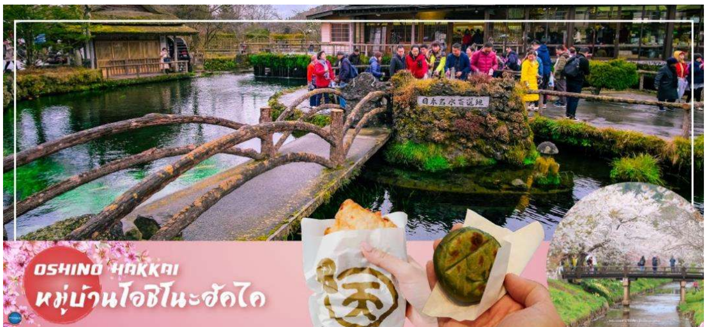
OSHINO HAKKAI หมู่บ้านโอชิโนะฮัคไค

จากนั้นนำท่านเดินทางสู่ หมู่บ้านโอชิโนะฮัคไค (OshinoHakkai) (ใช้เวลาเดินทางประมาณ 50 นาที) ให้ท่านเจาะลึกตามหาแหล่งน้ำบริสุทธิ์จากภูเขาไฟฟูจิ ที่เป็นแหล่งน้ำตามธรรมชาติตั้งอยู่ในหมู่บ้านโอชิโนะ จ.ยามานาชิ หรือพูดในทางกลับกันคือกลุ่มน้ำผุดโอชิโนะฮัคไค เพียงก้าวแรกที่ย่างเท้าเข้าไปในหมู่บ้านก็สัมผัสได้ถึงอากาศบริสุทธิ์ และไอเย็นจากแหล่งน้ำธรรมชาติที่มีให้เห็นอยู่ทุกมุม โดยในบ่อน้ำใสแจ๋วมีปลาหลากหลายพันธุ์แหวกว่ายอย่างสบายอารมณ์ แต่ขอบอกเลยว่าน้ำแต่ละบ่อนั้นเย็นจับใจจนแอบสงสัยว่าน้องปลาไม่หนาวสะท้านกันบ้างหรือ เพราะอุณหภูมิในน้ำเฉลี่ยอยู่ที่ 10-12 องศาเซลเซียสนอกจากชมแล้วก็ยังมีน้ำผุดจากธรรมชาติให้ดื่กดื่มตามอัธยาศัย และที่สำคัญ หมู่บ้านโอชิโนะยังเป็นแหล่งช้อปปิ้งสินค้าโอท็อปชั้นเยี่ยมอีกด้วย