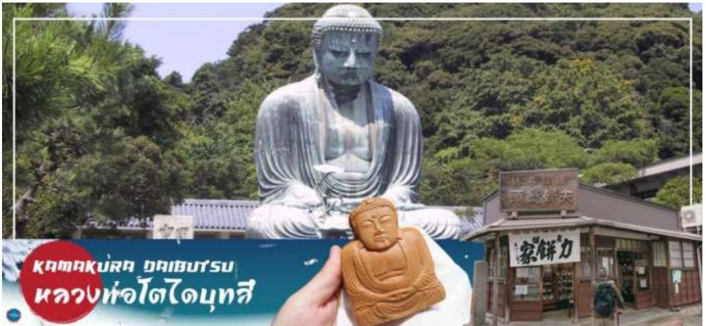
KAMAKURA ไดบุตสึ หลวงพ่อดิโดบุตสึ

วันที่สอง เมืองนาริตะ – เมืองคามาคุระ –พระใหญ่ไดบุตสึ คามาคุระ –ถนนโคมาจิโดริ –ศาลเจ้าสิริงะโอะกะ สะจิมัง– เมืองยามานาชิ –หมู่บ้านโอชิโนะสั๊กไก–ออนเซ็น + ชาบูยักษ์