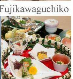
Yukari No Mori Fujikawaguchiko