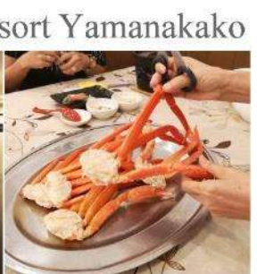
Hotel Alexander Royal Resort Yamanakako