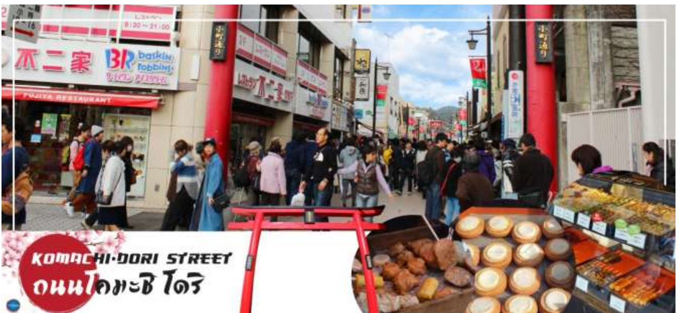
KOMACHI-DORI STREET ถนนโคมาจิโดริ

จากนั้นนำท่านท่านเดินสู่ ถนนโคมาจิโดริ (Komachi Dori Street) (ใช้เวลาเดินทางประมาณ 15 นาที) ตลอดระยะทางราวๆ 350 เมตรของถนนโคมาจิโดรินี้ เต็มไปด้วยร้านค้าละลานตากว่า 250 ร้าน ไม่ว่าจะเป็นร้านอาหารท้องถิ่น ร้านขายของที่ระลึก ร้านเช่ากิโมโน คาเฟ่แสนน่ารัก ร้านหนังสือ สินค้าทำมือ ขนมญี่ปุ่นโบราณที่หากินได้ยากจากที่อื่นร้านค้าส่วนมากยังอนุรักษ์รูปแบบอาคารดั้งเดิม ให้ความรู้สึกราวกับเดินในเมืองเก่าของญี่ปุ่นร้านค้าบางส่วนก็ปรับปรุงเปลี่ยนแปลงตามยุคสมัย