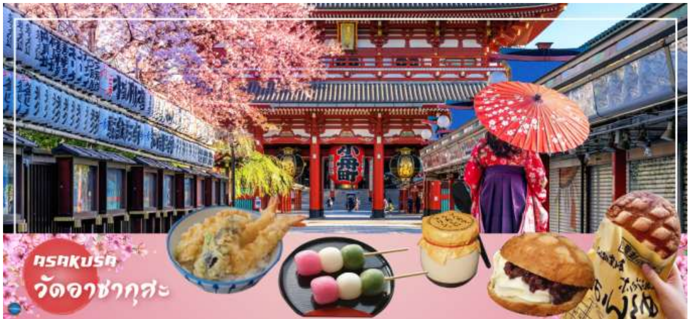
กรุณาชม วัดอาซากุสะ

วันที่สาม เมืองนาริตะ - กรุงโตเกียว - วัดอาซากุสะ - ช้อปปิ้งถนนนากามิเซะ - ถ่ายรูปโตเกียวสกายทรีริมแม่น้ำสุมิดะ - จังหวัดยามานาชิ - จุดชมวิวชั้น 5 ภูเขาไฟฟูจิ ( ขึ้นอยู่กับสภาพอากาศ) - หมู่บ้านโอชิโนะฮัคไค - ออนเซ็น + ชาบูยักษ์