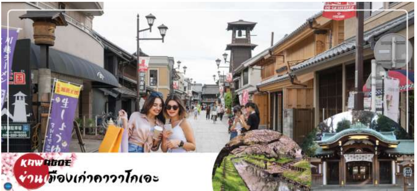
KAWAGOE ย่านเมืองเก่าคาวาโกเอะ

จากนั้นนำท่านขอพรความรัก ณ ศาลเจ้าฮิกาวะ (Hikawa Shrine) เป็นศาลเจ้าที่เชื่อว่าเด็ดยักษ์เรื่องขอพรความรักภายในมี "อุโมงค์เอมะ" "เอมะคือแผ่นไม้ที่เราเขียนขอพรและนำมาผูกจน