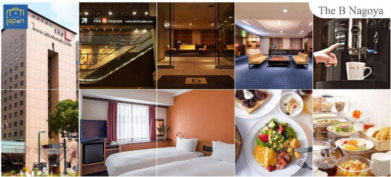
The B Nagoya

พักที่ HOTEL THE B NAGOYA หรือเทียบเท่าระดับเดียวกัน