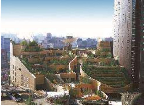
ห้ามพลาด