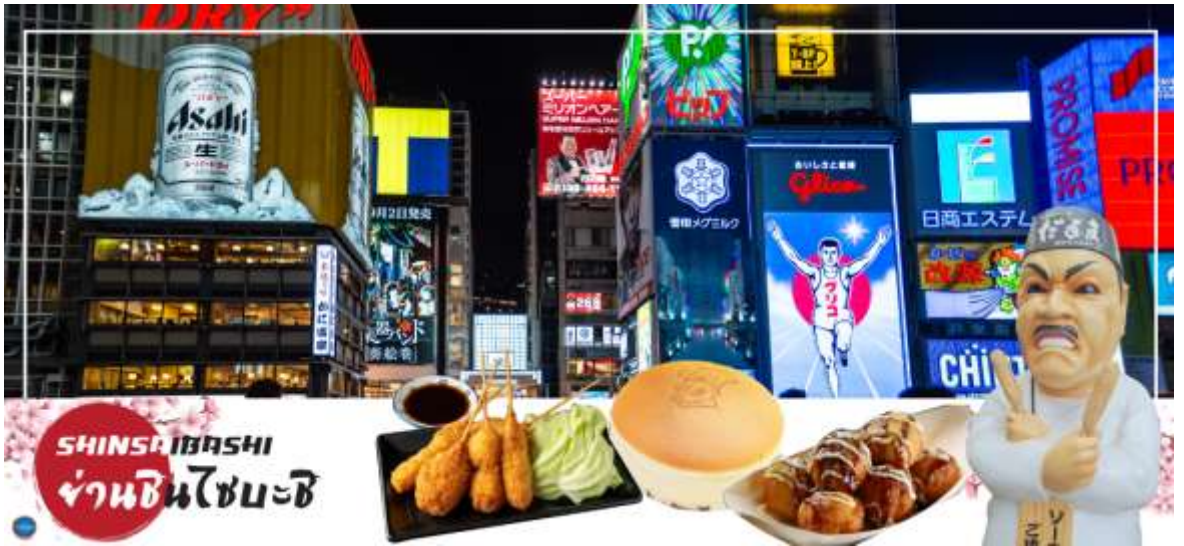
รับรองไม่ผิดหวังแน่นอน

จากนั้นอิสระช้อปปิ้ง ย่านชินไซบาชิ (Shinsaibashi) (ใช้เวลาเดินทางประมาณ 1 ชั่วโมง) บริเวณแหล่งช้อปปิ้งแห่งนี้มีความยาวประมาณ 600 เมตรเต็มไปด้วยร้านค้าปลีกร้านแฟชั่นร้านเครื่องสำอางค์ร้านรองเท้ากระเป๋านาฬิกาแว่นตาอาหารร้านขนมร้านเสื้อผ้าสตรีทแบรนด์ทั้งญี่ปุ่นและต่างประเทศเช่น Zara H&M Beans ABC Mart เป็นต้นเรียกว่ามีทุกอย่างที่ต้องการรวมกันอยู่ บริเวณนี้ใกล้กันท่านสามารถเดินไปยัง ย่านโดทงโบริ (Dotonbori) ย่านบันเทิงยามค่ำคึกคักตลอดแนวถนนเลียบบคลองโดทงโบริจากสะพานโดทงโบริบาชิไปจนถึงสะพานนิปปอนบาชิ ไฮไลท์!!! ใครๆก็เช็กอินถ่ายภาพคู่ป้ายกูลิโกะแมนหรือป้ายโดทงโบริกูลิโกะ (Dotonbori Glico Sign) เป็นป้ายไฟนีออนรูปนักกรีฑากำลังวิ่งอยู่บนลู่วิ่งซึ่งถูกติดตั้งมาตั้งแต่ปีค .ศ.1935 นอกจากนี้ยังมีอีกหนึ่งสัญลักษณ์สถานที่นัดพบกันหล่งนั้นก็คือร้านปูคานิโดรากุ (Kani Doraku) ซึ่งมีปุยักษ์ขยับแขนและลูกตาได้อีกด้วยและห้ามพลาดสำหรับทาโกะยากิอาหารท้องถิ่นของชาวโอซาก้าที่มาถึงถิ่นแล้วต้องลอง