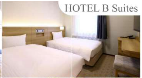
HOTEL B Suites