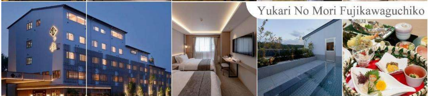
Yukari No Mori Fujikawaguchiko

ผิวพรรณสวยงามและช่วยให้ระบบหมุนเวียนโลหิตดีขึ้น