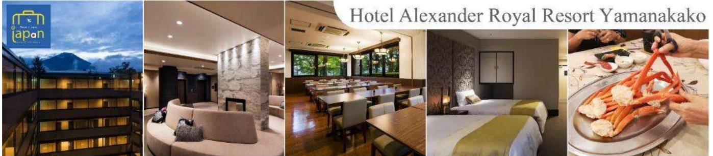
Hotel Alexander Royal Resort Yamanakako